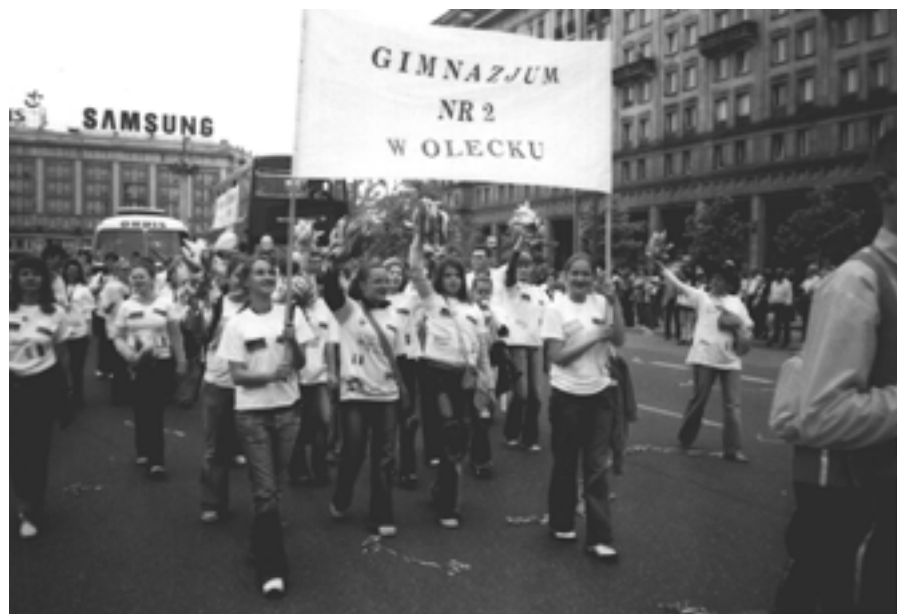
Przedstawiciele Gimnazjum nr 2 z Olecka na paradzie.