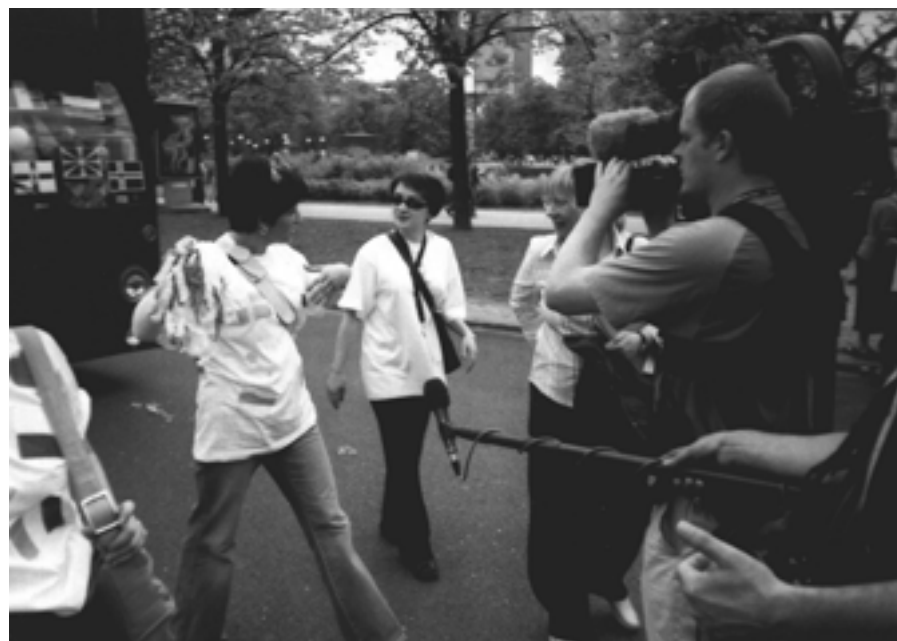
Wywiad dla TVP2.