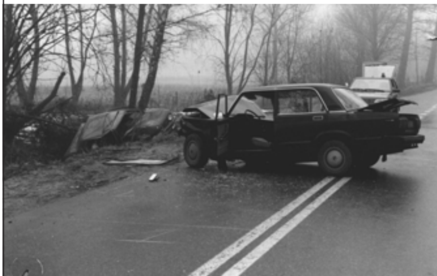
Przyczyna – nadmierna prędkość na łuku drogi. Jedna osoba ranna.