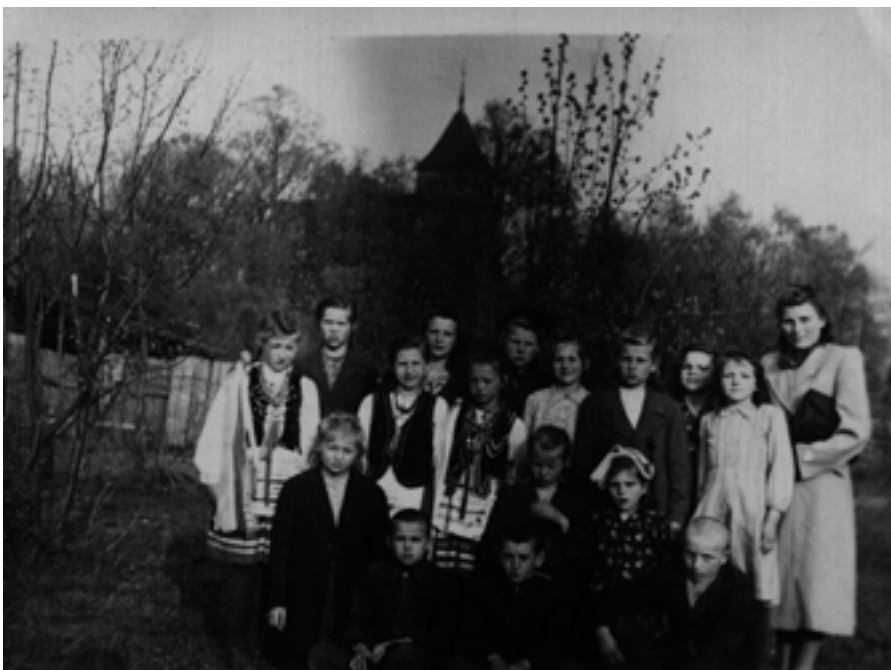
Wieliczki, moi uczniowie na akademii 1-majowej w Wieliczkach, klasy III+IV.