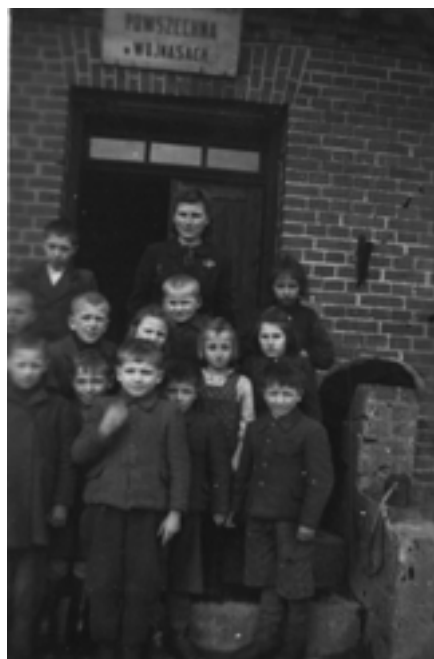
Wojnasy, moi uczniowie klas I + II w szkole.

W listopadzie 1950 roku trwały jeszcze prace wykończeniowe w pozostałej części budynku szkolnego, a dokładnie mówiąc układanie podłóg w mieszkaniu dla nauczyciela, czyli dla mnie. Tym remontem byłam szczególnie zainteresowana. Chciałam mieć w końcu prawdziwe mieszkanie, nie tylko jeden pokój, bez kuchni, bez oddzielnego wejścia. Pamiętam jeden listopadowy późny wieczór. Była godzina 23.00, przygotowywałam się do snu. Nagle podeszłam do okna, zupełnie odruchowo odsunęłam zasłonę... i wówczas w ciemności zauważyłam, że ktoś niesie od strony szkoły deski. Natychmiast uświadomiłam sobie, że te deski mogą być wynoszone ze szkoły. Nie zastanawiając się, szybko narzuciłam coś na siebie i wybiegłam na ulicę. Idąc wzdłuż zabudowań szukałam okien, w których paliło się światło. Była prawie północ, a ludzie tutaj nie mieli zwyczaju późno chodzić spać. Nagle zauważyłam światło w bu-