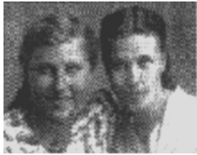
Ja z koleżanką.

Kiedyś zaproponowały nam wspólne pójście na poziomki. Oświadczyły, że ta wyprawa potrwa aż trzy dni, dlatego musimy otrzymać zwolnienie z pracy na ten czas. Powiedziały, że chodzą tam co roku i zbierają bardzo dużo aromatycznych owoców. Byłyśmy chętne wziąć udział, ale musiałyśmy uzgodnić to z rodzicami i rodzeństwem. Na drugi dzień dałyśmy odpowiedź pozytywną. Ustalony został termin wyprawy. One załatwiły nam i sobie zwolnienie z pracy. W ustalonym dniu, o świcie, siedmioosobowa grupa — cztery Polki i trzy Rosjanki — wszystkie w wieku piętnastu – dziewiętnastu lat wyruszyła w drogę. Każda z nas zabrała swój ekwipunek: węzełek z chlebem, butelkę z wodą i bańkę na po-