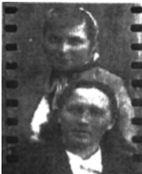
Autorka u góry.

Słońce już zniknęło z horyzontu, kiedy doszłyśmy do celu naszej wyprawy. A tu wielkie rozczarowanie — na ogromnej polanie i południowej skarpie, gdzie miały rosnąć poziomki, nie ma nic. Trawa zo-