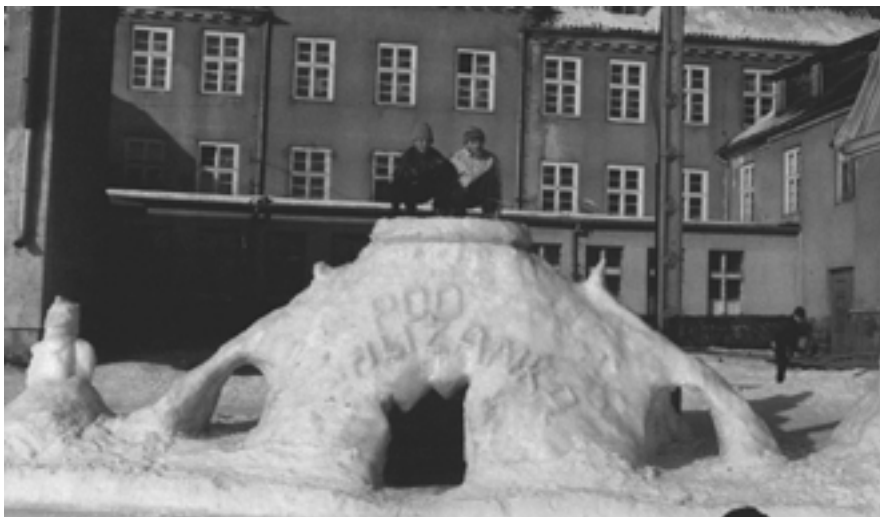
W rozbitej filiżance wypić można kawę lub herbatę po jej zamówieniu w kawiarni. Wewnątrz grotty znajduje się śnieżny stolik, a przy nim śnieżne ławy.

Targu. W poniedziałek wszystkie klasy miały w-f na lodowiskach, a amatorzy hokeja mogli poganiać za krążkiem. We wtorek lodowisko duże i „Liliput” nie zamarzyły, pomimo to na średnim odbywały się normalne zajęcia. Wieczorem pan Wojnowski rozpoczął trening o godz. 18. na dużej tafli. Okazało się jednak, że normalnego treningu nie mógł przeprowadzić ze względu na zły stan lodu, natomiast pozwolił chłopcom pograć w hokeja. Półgodzinną grą w hokeja duże lodowisko zostało całkowicie zniszczone i potrzeba było trzech dni, aby doprowadzić je do normalnego stanu. W dniu 10 lutego trening chłopców odbywał się w prawie idealnych warunkach, chociaż przy dużym nasłonecznieniu wystąpiła w kilku miejscach woda.