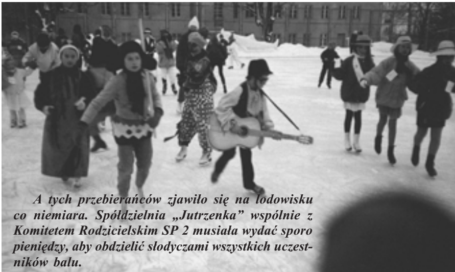
A tych przebierańców zjawilo się na lodowisku co niemiara. Spółdzielnia „Jutrzenka” wspólnie z Komitetem Rodzicielskim SP 2 musiała wydać sporo pieniędzy, aby obdzielić słodyczami wszystkich uczestników balu.

W niedzielę pan Wojnowski rozpoczął o godz. 13. trening, przygotowując ekipę chłopców na wyjazd do Nowego