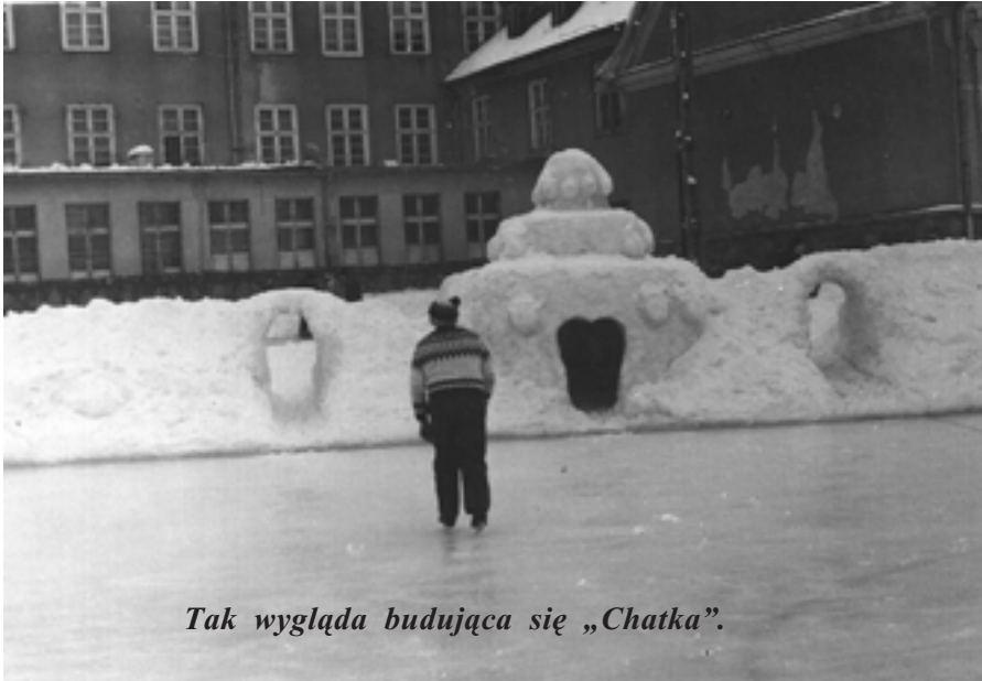
Tak wygląda budująca się „Chatka”.

3 i 4 stycznia lodowisko duże i „Liliput” są czynne. Podczas lekcji tylko pani Gościk korzysta z lodu. Wieczorem, po całodziennym jeździe, lodowisko duże nie zostało polane, a temperatura plusowa