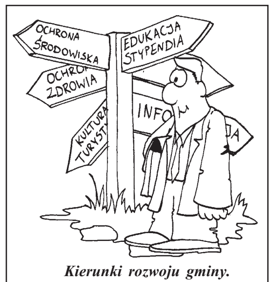
Kierunki rozwoju gminy.