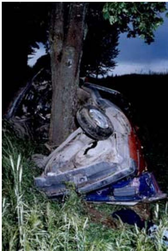
Przyczyna: nadmierna szybkość – śliska jezdnia.