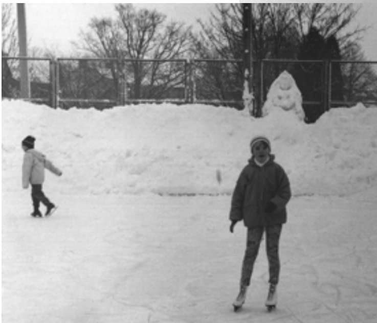
„Królowa Zima” przysypana śniegiem.