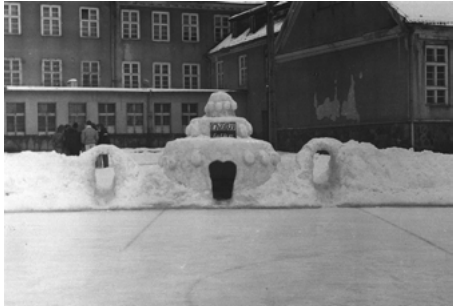
Osiemdziesięciolatka jeszcze z tunelami.