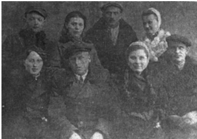
Autorka (trzecia od lewej) z grupą przyjaciół.

Wszystko wskazywało, że nie, bo jak udowodnimy, że jesteśmy Polkami. Przecież wszystkie dowody i dokumenty nam zabrali. Był ranek, kiedy dotarłam do domu. Cieszyliśmy się, że znowu jesteśmy razem. Ale co dalej? Mama mimo wszystko nie traciła nadziei. Wierzyła w Opatrzność Bożą i pocieszała mnie, moją siostrę i wszystkie kobiety, z którymi rozmawiała, że kiedyś wrócimy do Polski. Z tą wiarą dalej toczyło się życie na zesłaniu.