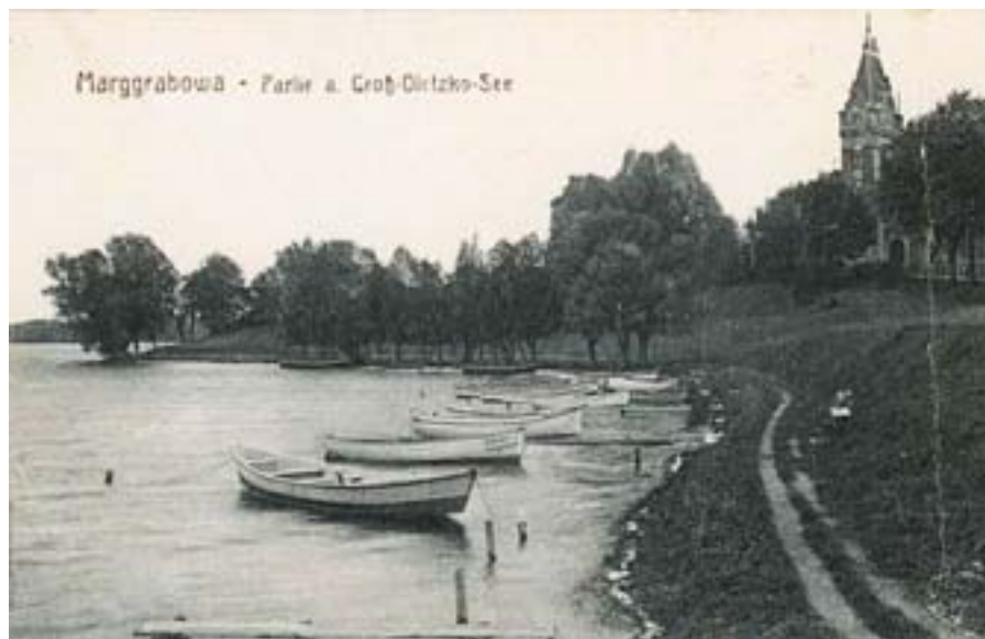
Fotografia części omawianego fragmentu jeziora przed I wojną światową (około roku 1900).

W dniu 14 lutego 2006 r o godz. 14-ej odbyło się posiedzenie pojednawcze w Sądzie Grodzkim w Olecku, gdzie strony ustaliły, że oskarżony przeprosi w prasie „Tygodnik Olecki” oskarżyciela. Nie było podanej treści przeprosin.