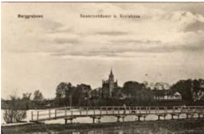
Widok ujścia rzeki Legi. Fot. sprzed I wojny światowej (ok. 1900r.). Na fotografii nie ma trzciny!!!

Odpowiedź Wojewódzkiego Konserwatora Przyrody na pismo, które wpłynęło 20 lutego 2006 roku do Urzędu Wojewódzkiego w Olsztynie skarżące poczynania Burmistrza takie jak wycięcie trzciny przy ujściu Legi oraz zbudowanie progu wodnego na rzece (kilkadziesiąt metrów za kamiennym mostem pieszym łączącym brzegi Legi w okolicach jej ujścia z jeziora):