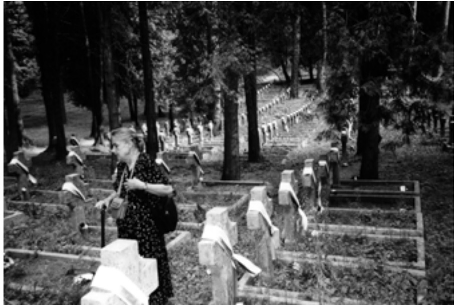
Cmentarz Bernardyński w Wilnie.