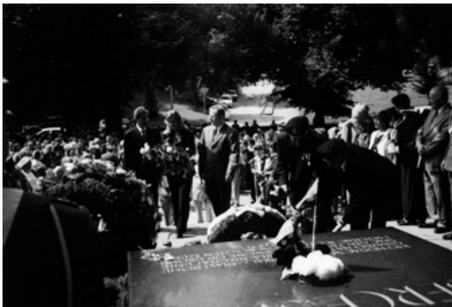
Grób matki marszałka Piłsudskiego i jego serca na cmentarzu Rossa w Wilnie.