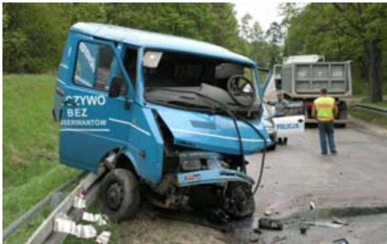
Wypadek w okolicach Doliw.