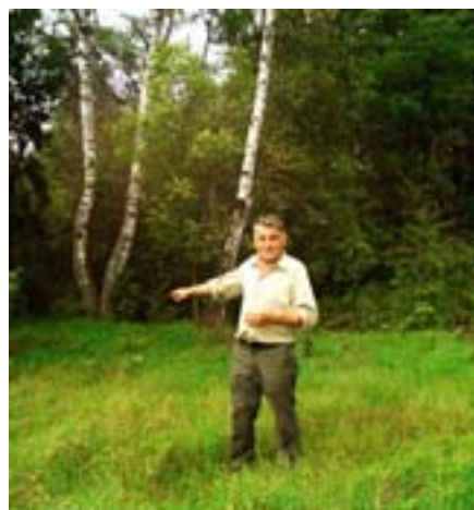
W tym miejscu stała gajówka, przy której mjr Henryk Dobrzański rozwiązał oddział WP i jako „Hubal” podjął walkę partyzancką.

biety, dotychczas nie uhonorowane jakąś publikacją, to były niezłomne „Matki Polki”, „dziewczyny Polki”, „narzeczony Polki”. Byłam świadkiem rozstawania się, kiedy szli na Grzędę młodzi chłopcy. Wtedy te dziewczyny, czekające na ślub, zacięły się, płakały, trzęsły się, ale ich nie powstrzymywały. Tak zrodził się ten czyn. Ja chcę powiedzieć, że akcją „Burza” i niemieckie przygotowania do zniszczenia pułku przeżywałam pod twierdzą Osowiec, bo tam szukaliśmy spo-