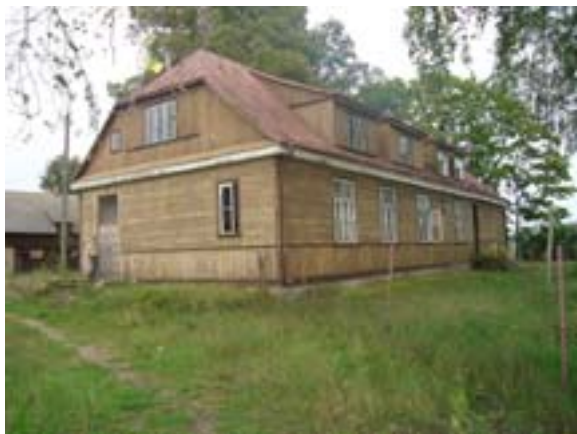
Była szkoła. Podczas wojny mieścił się tu posterunek żandarmerii niemieckiej.