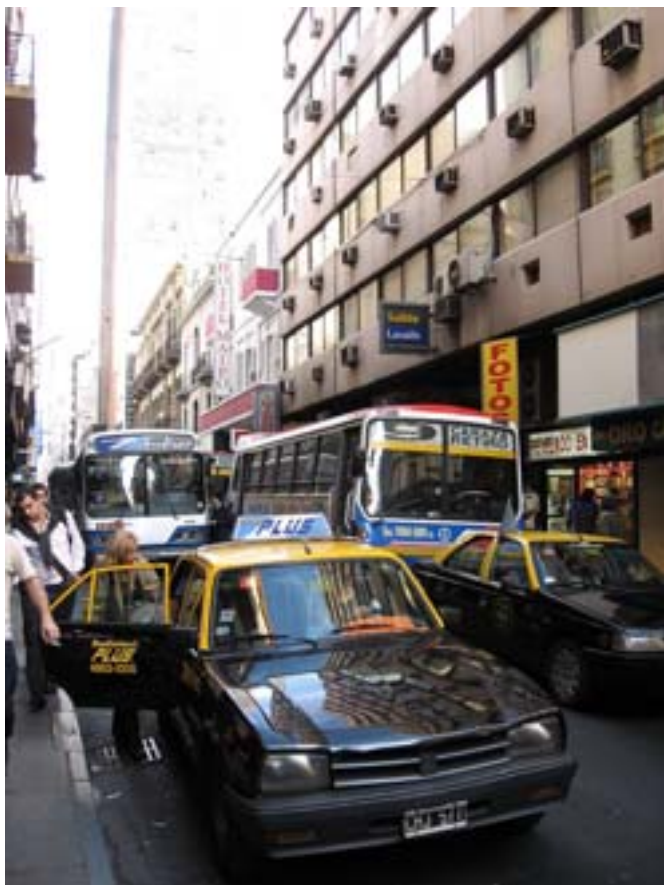
Zatłoczone ulice Buenos Aires

Powoli jej siła i duch przedsiębiorczości zaczynał zanikać. W latach 1950-1952, chociaż wiedziała o swojej ciężkiej chorobie (miała raka macicy), nie zgadzała się na leczenie ani na zaakceptowanie rzeczywistości, a kiedy już pogodziła się z losem, było zbyt późno, aby ją uratować. Jej determinacja była jednak wielka i kiedy nadeszły drugie wybory prezydenckie, Eva dzielnie wspierała swojego męża, jednocześnie dbając o interesy ludu. Po wyborze Peróna na drugą kadencję, jeździła wraz z nim po ulicach miast, dziękując za zaufanie jakim ludzie go obdarzyli. Były to już niestety ostatnie dni z jej życia. C.d.n.