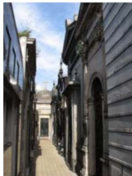
Cmentarz jak miasteczko.

końcu przyszła. Poznała wtedy generała Juana Peróna. W wyniku związku z Perónem, Eva zaczęła aktywnie uczestniczyć w życiu publicznym, realizując program propagujący osobę jej kochanka. Szczególnie dbała o to, aby swoim słuchaczom w radiu przybliżyć i jak najlepiej zaprezentować jego obraz oraz program reform „Ku lepszemu światu”. Ale fakt, iż była tak bardzo udzielającą się w życiu politycznym kobietą irytowała wojskowych i Perón został usunięty ze swego stanowiska w Ministerstwie Pracy i uwięziony na wyspie Martina Garcí. 17 października 1945 r. Eva zorganizowała pochód mający na celu zwol-