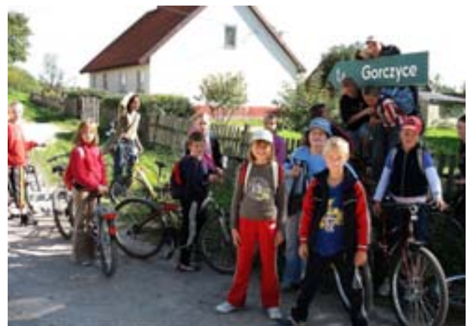
Wyprawa rowerowa. Postój w Monetach.