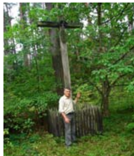
Jeden z krzyży upamiętniający tragiczne dzieje Ziemi Grajewskiej na terenie Czerwonego Bagna.