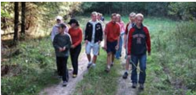
Członkowie klubu geograficznego na zajęciach w lesie.

Okazało się, że uczniowie znają tylko kilka gatunków pospolitych grzybów. Omijają te, które są jadalne, ale wcześniej nie były zbierane przez ich rodziców i ich samych. Bez problemu za to wskazują grzyby trujące, jak chociażby muchomora czerwonego, cytrynowego, kolczaka, olszówkę czy gołąbka wymiotnego. Po udzieleniu kilku wskazówek i rad uczniowie sami