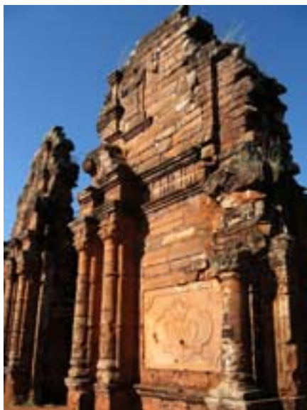
Ruiny misji jezuickiej w San Ignacio Mini

Po przejechaniu 50 km zatrzymałem się w San Ignacio Mini, żeby obejrzeć ruiny misji jezuickiej. Misja ta w 1773 roku liczyła blisko 4,5 tysiąca Indian. Włoski jezuita Juan Brasanelli zaprojektował ogromny kościół z czerwonego piaskowca, zdo-