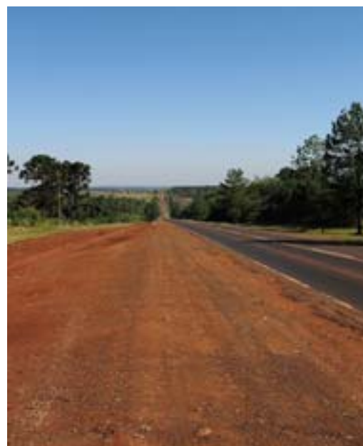
Droga przez prowincję Misiones