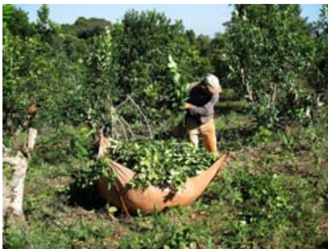
Na plantacji yerba mate