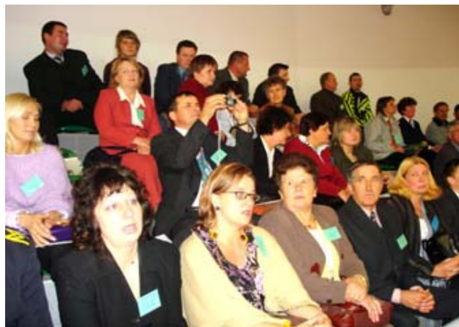
Absolwenci różnych roczników.