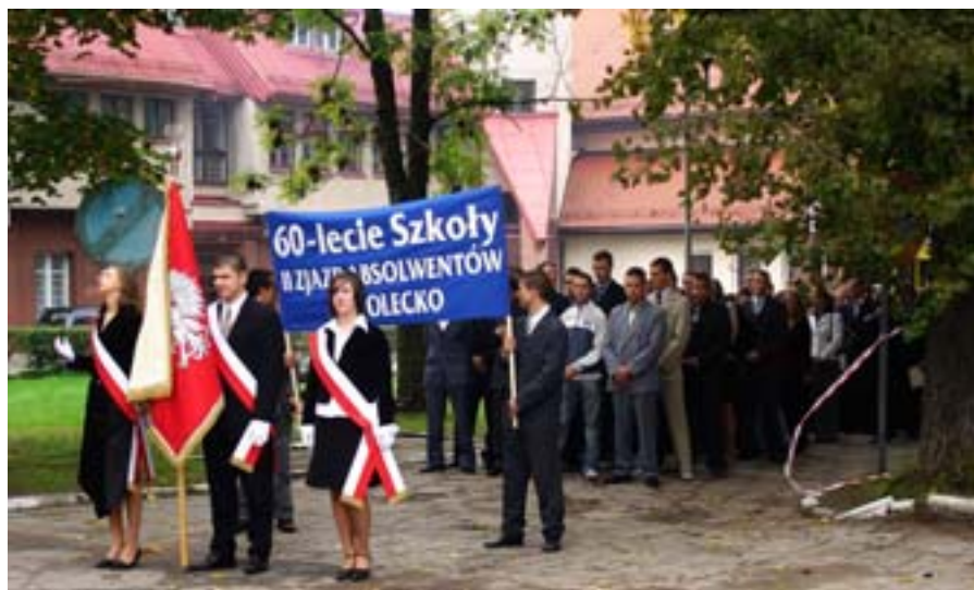
Poczet sztandarowy i wymarsz na mszę.