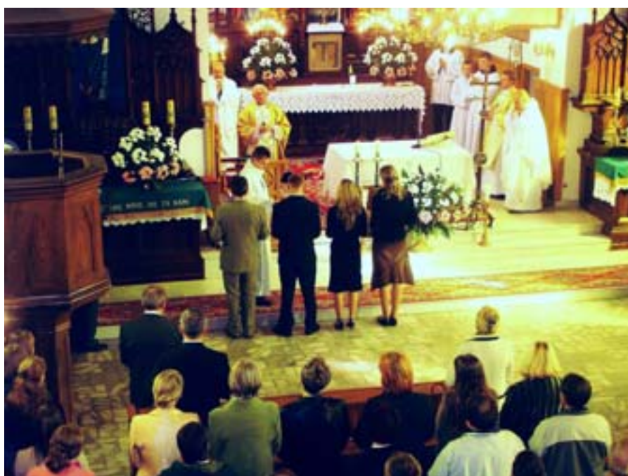
Msza uczestników II zjazdu absolwentów ZST.