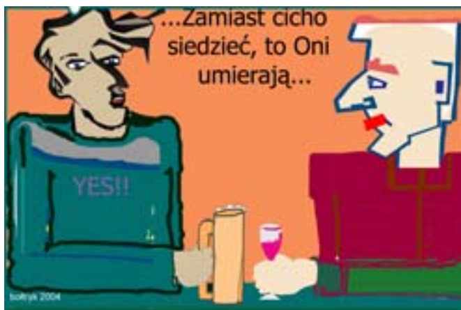
Rys. W.B. Boltryk

To, że ktoś nie zna matematyki wcale nie znaczy, że jest humanistą.