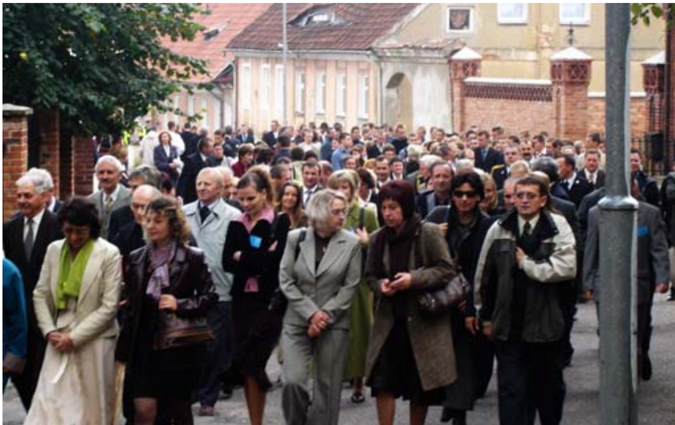
Przemarsz uczestników II zjazdu absolwentów z kościoła do szkoły.