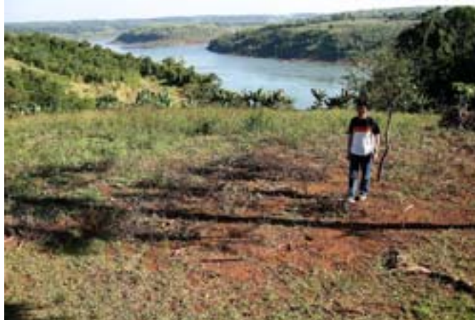
Za mną rzeka Parana

Miałem szczęście, ponieważ na plantacji pracowali robotnicy. Akurat mieli przerwę obiadową. Zbliża-