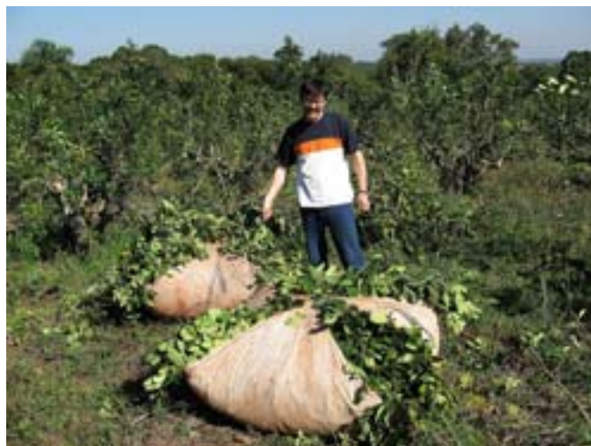
Ja też dołożyłem swoją gałązkę yerba

łem się do nich powoli, i oni też powoli, jakby wstydząc się, kończyli jedzenie. Powiedziałem „Buenos tardes” (dzień dobry), uśmiechnąłem się i oni też mi się tym samym odwzajemnili. Poczułem się zaakceptowany i poszedłem fotografować yerbę. Robotnicy popijali yerba mate z wydrążonego owocu zapallo (odmiana dyni), który służy jako kubek (inni mieli stalową bombilli), posługując się przy tym metalowymi rurkami z filtrem zastępującymi łyżeczkę i jednocześnie słomkę do picia. Obok stały termosy z wrzątkiem. Kiedy zauważyli, że żywo intere-