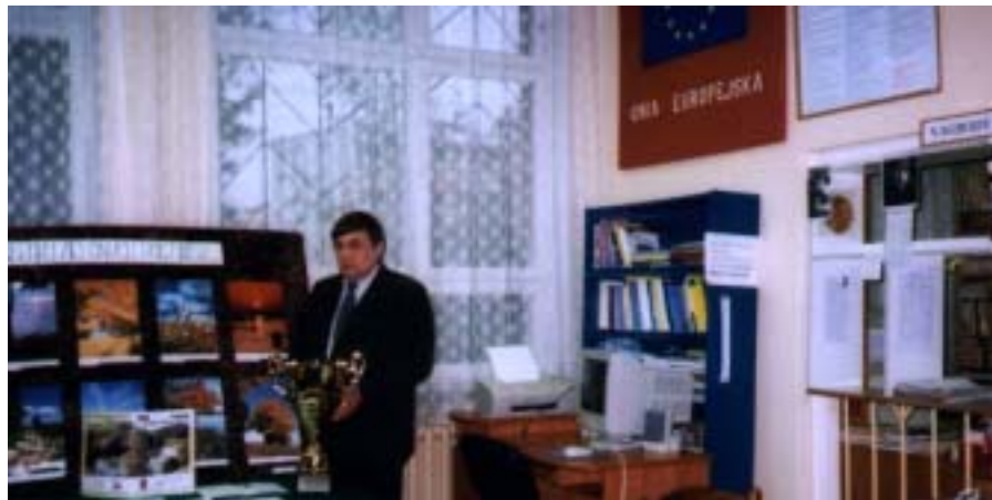
Laureat w „bibliotece otwartej” ZSLiZ i zdobyte w Siedlcach trofea.