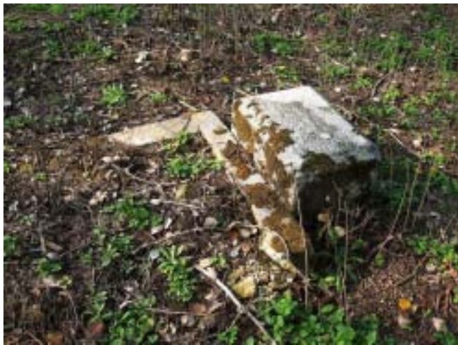
Suwalski PK, Wodзилki.

Tysiąc lat temu zmarłych chowano w różnych miejscach, pod progami domów, w sadach, na polach. Dopiero po chrzcie Polski cmentarze zaczęły pojawiać się przy kościołach i poza nimi. Dzisiaj dbamy, jak najbardziej, o cmentarze katolickie, miejskie i wiejskie, gdzie spoczywają nasi najbliżsi, a zapominamy o innych, które istniały dawno temu, porozrzucanych po lasach, łąkach i przydrożnych chaszczach. Są wśród nich cmentarze wojskowe: polskie, rosyjskie, niemieckie i wyznaniowe: żydowskie, ewangelickie, prawosławne.