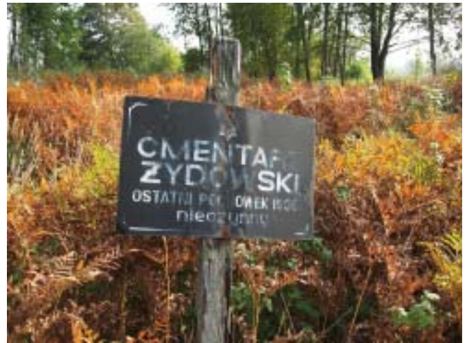
Cmentarz żydowski (wyznania mojżeszowego) w Przerośli.

ziemi i spróbować lepiej zrozumieć historię małej ojczyzny, powinniśmy zapomniane cmentarze przypomnieć, by ludzie, którzy na nich spoczywają, mogli znów liczyć na wspomnie-nie i szacunek. Są one także szczególnym źródłem wiedzy o dziejach minionych pokoleń.