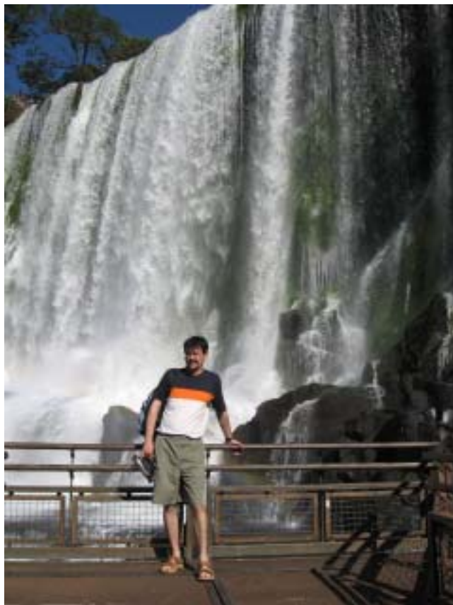
Stoję przy jednej z kaskad

bazaltowy płaskowyż, który kończy się powyżej jej ujścia do Parany. W tym miejscu kręcony był nawet film „Misja”. Brytyjski aktor Jeremy Irons, grający rolę jezuickiego misjonarza, dramatycznie wspina się po niemal pionowej i śliskiej od spływającej wody ścianie skalnej. Ściana sąsiaduje z ogromnym wodospadem, więc huk spadającej wody ogłusza. Doświadczyłem tego! A film był taki sobie.