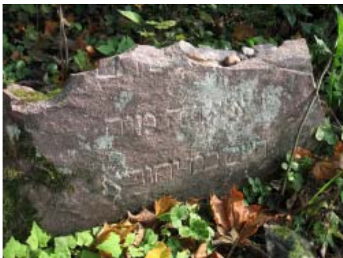
Suwalski PK, Wodзилki.

Szacunek dla miejsc pochówku jest jednym z fundamen-tów kultury, jest miarą naszego człowieczeństwa. Dzisiaj, aby po ludzku zachować się wobec tych, co spoczywają w naszej