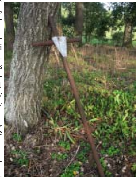
Na cmentarzu ewangelickim w Szeszupce za Przeroślą.

Na świecie istnieje wiele polskich gro-bów i cmentarzy. Miejmy nadzieję, że ktoś również się o nie za-troszczy.