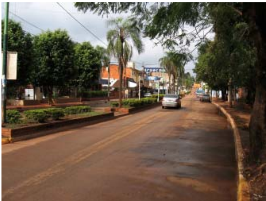
Miasteczko Puerto Iguazu

Miasteczko to jest niewielkie. Można tu kupić jednak sporo pamiątek. Usiadłem na chwilę w przydrożnej restauracyjce, żeby coś zjeść. I dopiero wówczas zauważyłem, że miejscowi mają na sobie ubrania w kolorach flagi państwowej (niebiesko-białe), machają chorągiewkami i się cieszą. Wszak za kilka godzin miał się rozpocząć mecz w ramach piłkarskich mistrzostw świata. Grała Argentyna przeciwko Wybrzeżu Kości Słoniowej i oczywiście wygrała (2:1). W związku z tym, będąc już w hostelu, dostałem za darmo jakieś mięso z rożna i szklanke alkoholu cytrynowego. Mięso zjadłem, ponieważ było wymienione, ale z procentowego wynalazku nie skorzystałem. Wziąłem za to sobie gorącą kąpiel i leżąc już na piętrowym łóżku, rozmyślałem o swoim wyczynie na rurze!