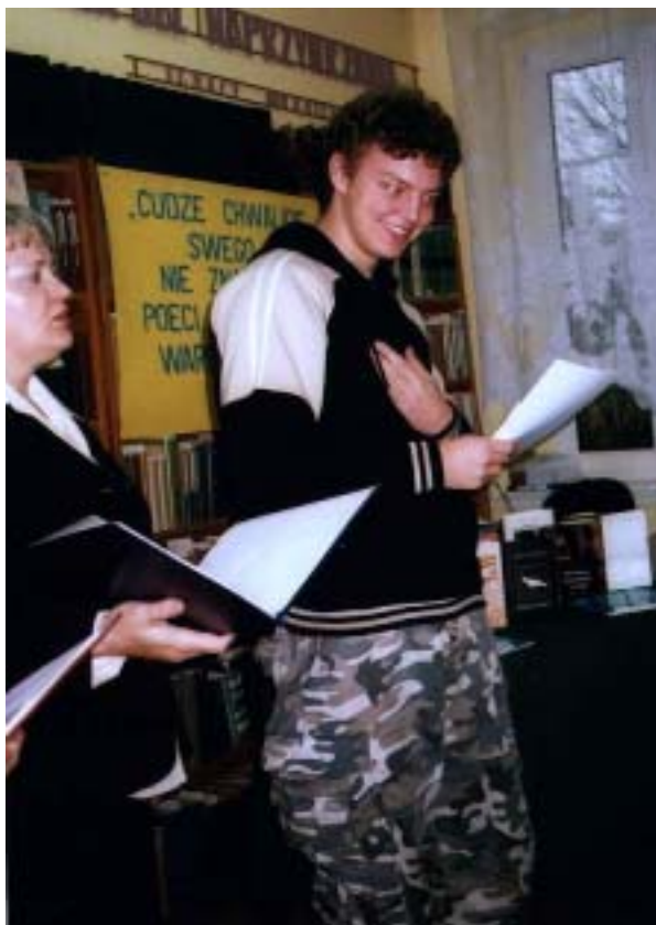
Wiosna z uśmiechem na ustach i wierszem „Kwiecie”.

Tym razem mieliśmy dwie dwugodzinne prezentacje: dla Liceum Dziennikarskiego Zespołu Szkół nr 2 oraz dla Technikum Mechatronicznego, obie w Zespole Szkół Mechaniczno-Elektrycznych. Elektryzowaliśmy przyszłych publicystów i budowniczych Krzemowych Dolin liryką oraz satyrą twórców z Tej Ziemi i nie było to w żadnym wypadku mechaniczne odwalanie roboty. W pracy dla ducha też trzeba się nieźle napocić, by poetyckiej lokomotywy nie wygwizdano na kolejnym przystanku, bo co innego gwizdy na meczu i rockowym koncercie, a co innego w bibliotecznych ustroniach. Mimo ryzyka rozminięcia się z oczekiwaniami ideą „biblioteki otwartej” pozostaje otwar-