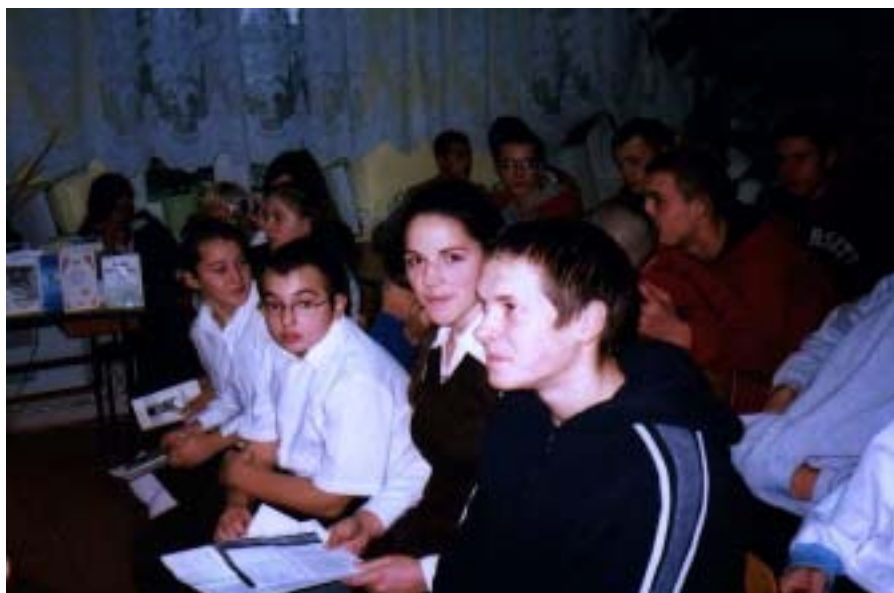
Nasi i Wasi to właśnie MY.