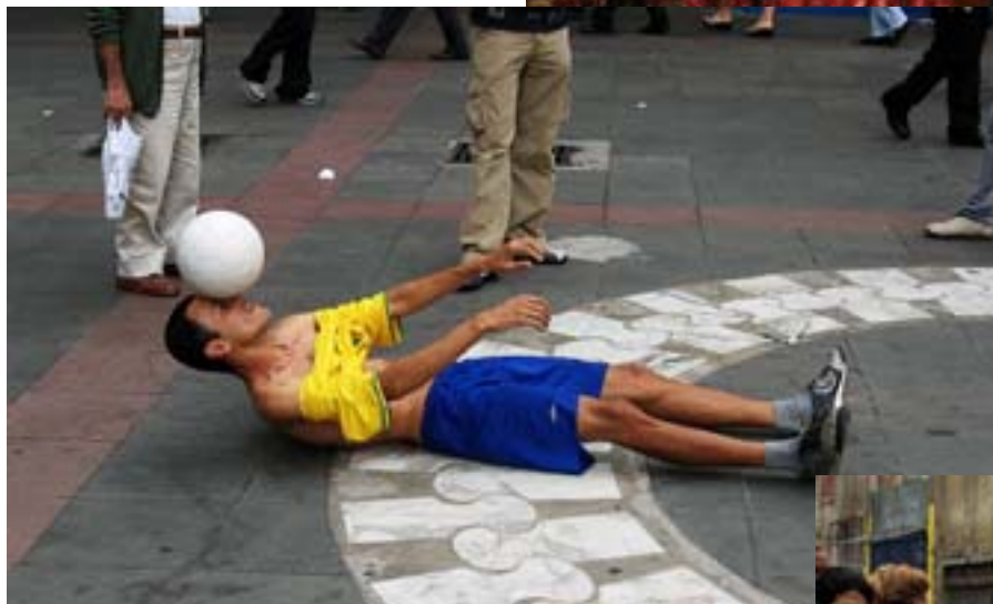
Tak też można zarabiać na życie

workach, gazetach, szmatach. Są wszędzie! Na szczęście nie zaczepiają turystów, których na razie w ogóle nie widziałem. O zmroku na 100% żaden biały turysta nie wyjdzie sam na ulicę – bandyci, prostytutki, naganiacze i naciągacze. Hotele też nie są bezpieczne. Na pocztówkach i w telewizji Sao Paulo wygląda pięknie. W rzeczywistości jest brzydkie i biedne, brudne, domy zaniedbane, ludzkie kupy na chodnikach – a to już przesada. Ja rozumiem starożytny Rzym, gdzie o toaletę było trudno, a rzymskimi wąskimi uliczkami płynęły ludzkie ekskrementy, ale tutaj..., w XXI wieku..., w tak słynnym mieście?! Sorry, Rzym też był słynny! Tylko, że tam biedacy krzyczeli: „Chleba i igrzysk!”. Dla nich to władze organizowały bezpłatne rozdawnictwo zboża. Tu, w Brazylii, biedacy umierają w... milczeniu, zdani tylko na siebie. 50% obywateli Brazylii to potomkowie niewolników.