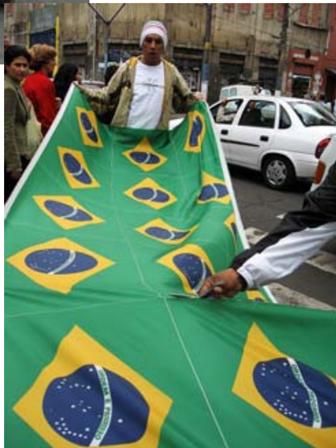
Flagę brazylijską można kupować na metry.

Po południu poszedłem do hotelu Edificio Italia – drapaczka chmur i wjechałem windą (bezpłatnie) na 41 piętro. Jest tu taras, z którego rozciągają się przednie widoki. Panorama miasta jak na dłoni. Z wysokości 165 metrów Sao Paulo wygląda znacznie lepiej. I dopiero wtedy poczułem, że naprawdę jestem w tym 17-milionowym mieście. Spacerowałem też po starym centrum, podziwiając chlubę miasta – Teatro Municipal, który łączy tradycję