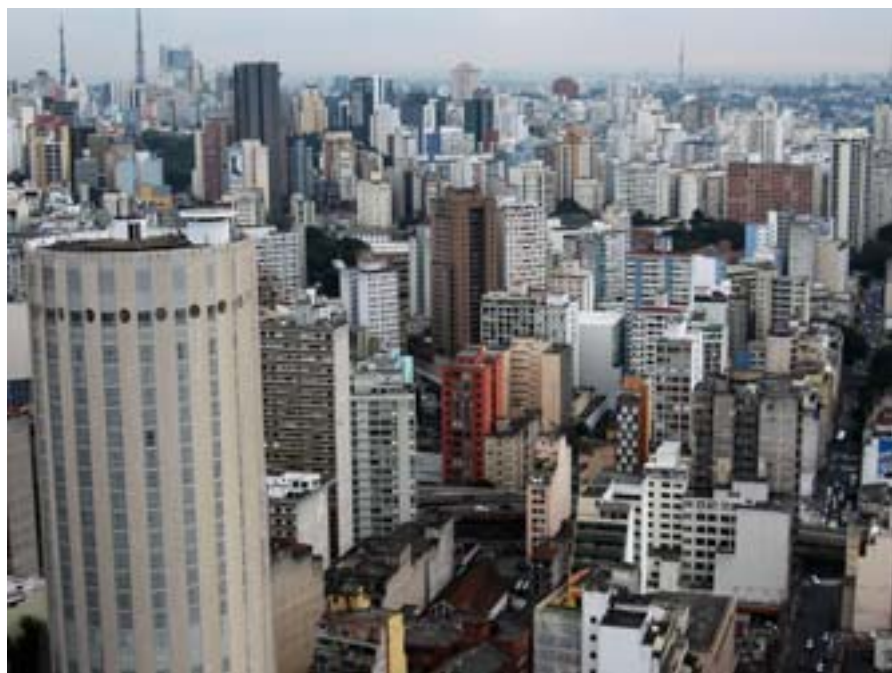
Widok na Sao Paulo

Przed godziną 8. udałem się do metra, ale najpierw kupiłem bilet na przejazd, stojąc w bardzo długiej kolejce. Metro zatłoczone, ludzi mrowie – typowe postaci z brazylijskich tasiemcowych seriali typu Esmeralda. I jak na ironię prze-