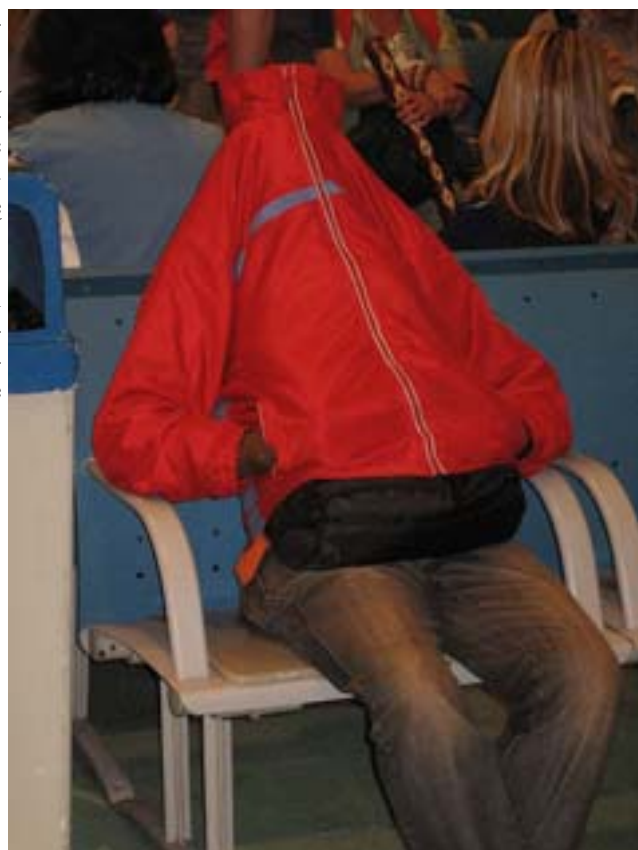
Pan bez głowy.