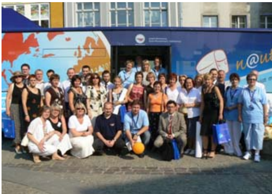
Inauguracja n@utobusu w Olsztynie.

logię do pojazdu zapewniły firmy informatyczne. Wszystkie urządzenia na pokładzie n@utobusu są zasilane z własnego generatora, można je także podłączyć do sieci miejskiej.