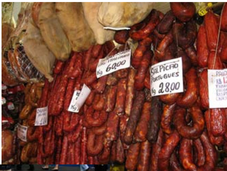
Droga brazylijska kielbasa.

Okazało się, że doba w hostelu zaczyna się od godziny 12.00, więc musiałem jeszcze dość długo koczować, by móc znaleźć się w pokoju na twardym drewnianym łóżku. Zostawiłem plecak, dokumenty i pieniądze na portierni i udałem się na zwiedzanie miasta. Od razu natknąłem się na nędzarzy, którzy koczują na ulicach, są bezdomni, brudni, bardzo biedni i bardzo głodni. W zasadzie wszyscy z nich to Murzyni. Leżą i śpią na