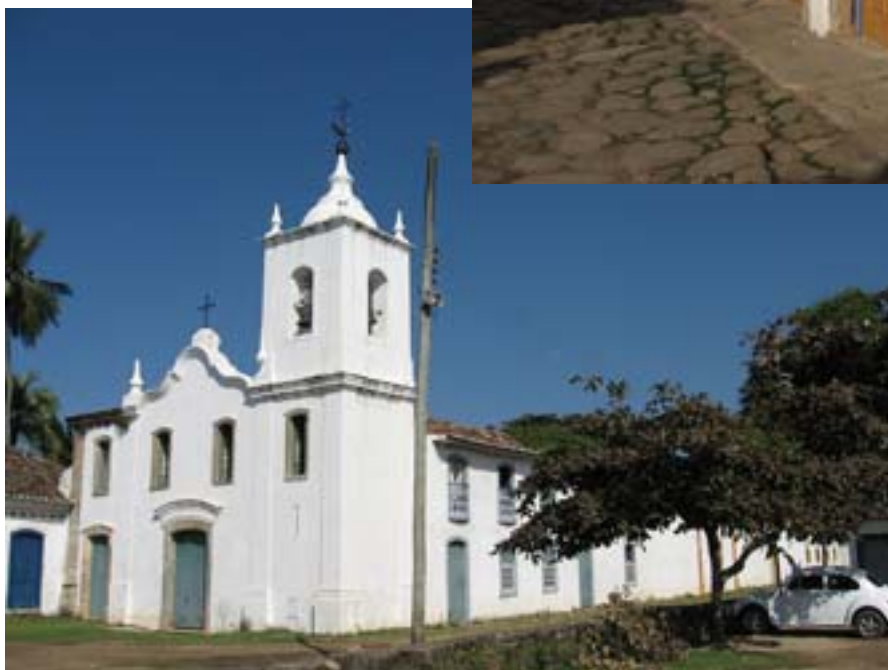
Kościół dla wyzwolonych niewolników

W hostelu było zimno, ale za to śniadanie obfite i nawet smaczne, typu „szwedzki stół”. O godzinie 9.50, wynajętym samochodem (za 40 dolarów), wyjechałem z Sao Paulo w kierunku Oceanu Atlantyckiego, do Parati. Po prawie pięciu godzinach jazdy byłem na miejscu. Przejeżdżałem przez strzeżone miasto, w którym znajduje się dość okazałych