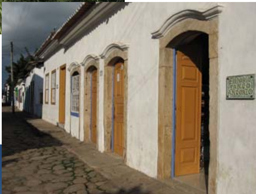
Kolonialne domy w Parati

Parati to niewielkie, ale sympatyczne miasteczko o kolonialnej architekturze. Doskonale zachowała się jego zażytkowa część. Powstanie Parati związane było z wybuchem gorączki złota w stanie Minas Gerais. Do miasta przywożono złoto i diamenty, transportowano je dalej do Rio de Janeiro, a także statkami do Portugalii. Gdy w 1822 roku Brazylia ogłosiła niepodległość, wstrzymano eksport złota. Ponadto wybudowano nową drogę z Rio de Janeiro do Sao Paulo omijającą Parati. Wówczas miasto straciło swoje znaczenie i zostało w pewnym sensie zapomniane. Ponowne ożywienie przyniósł boom kawowy w XIX wieku.