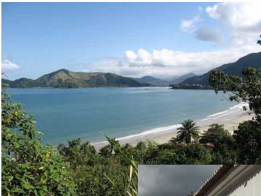
Jedna z zatok nad Oceanem Atlantyckim

W hostelu było zimno, ale za to śniadanie obfite i nawet smaczne, typu „szwedzki stół”. O godzinie 9.50, wynajętym samochodem (za 40 dolarów), wyjechałem z Sao Paulo w kierunku Oceanu Atlantyckiego, do Parati. Po prawie pięciu godzinach jazdy byłem na miejscu. Przejeżdżałem przez strzeżone miasto, w którym znajduje się dość okazałych