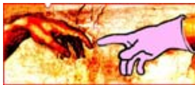
Rysunki: Wiesław B. Boltryk