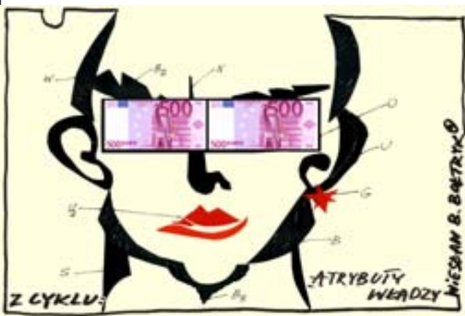
Z cyklu: Atrybuty władzy.

Stowarzyszenie Powiatów, Miast i Gmin „Stowarzyszenie EGO KRAINA BO-CIANA” zostało wybrane przez Akademię Rozwoju Filantropii w Warszawie do prowadzenia na obszarze powiatów elckiego i oleckiego Konkursu dla młodzieży – Pracownia Umiejętności.