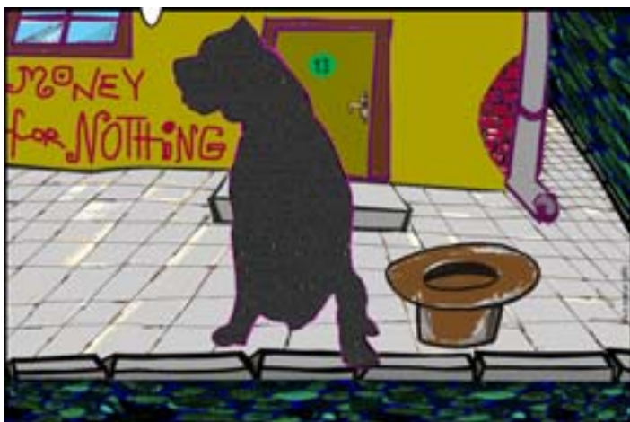
Chiny. Rys. Wiesław W. Boltryk

Gdy nadejdzie wiosna, spotkam ją. W oczy spojrzę głęboko, Czekam na pierwszy letni wiatr.