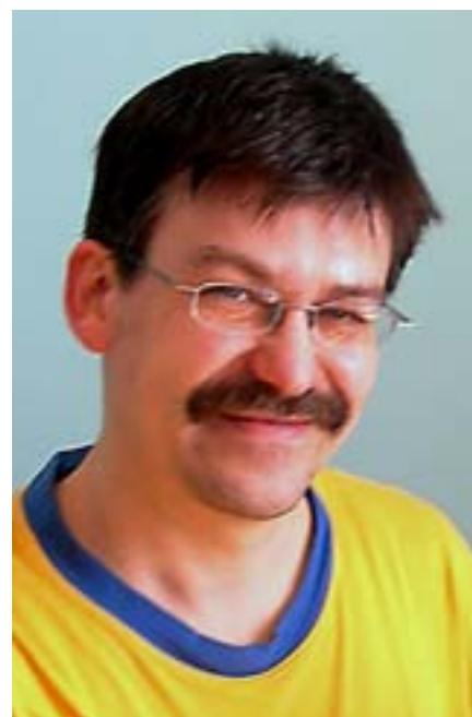
Na zdjęciu: autor.

nictwo, blokowiska, dziury w jezdni i na chodnikach, na których co kilkadziesiąt metrów leżą narkomani i młodzież z jakiegoś odłamu kulturowego obwieszana sznurami, łańcuchami i pijana. Ściany budynków w graffiti. W ulicznych kafejkach sporo Niemców i muzułmanów. Na rzece Szprewa oglądaliśmy skoki na banie. W drodze powrotnej zapoznaliśmy się z rozkładem stacji metra, by jutro z rana się nie denerwować. Poszliśmy spać o godz. 23 nie mając pewności czy wstaniemy o godzinie 5 (nie mamy budzika) i nie spóźnimy się na samolot.