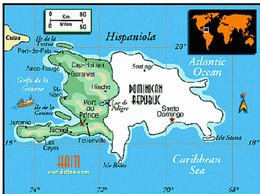
Hispaniolamap - na wyspie Haiti znajdują się dwa państwa: Dominikana i Haiti