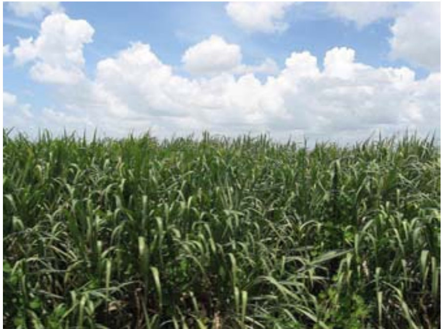
Trzcina cukrowa wyższa od autobusu

to, gdzie byliśmy pierwszego dnia, tak więc koło się zamknęło. Zamieszkaliśmy w tym samym hotelu co poprzednio – Pasada Inn, płacąc tyle samo – 55 dolarów za pokój. W hostelu obok był wolny pokój dwuosobowy za 40 dolarów (bez śniadania). Wybraliśmy jednak Pasada Inn, bo w porównaniu z tamtą norą, był pałacem. Jedynym atutem nory było okno z