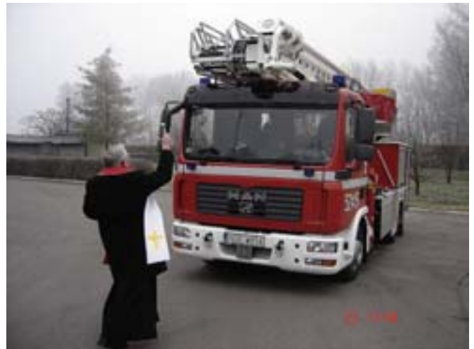
Poświęcenie samochodu przez księdza prałata Stanisława Tabakę.