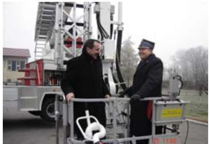
Prezentacja samochodu z Burmistrzem Olecka i komendantem wojewódzkim.