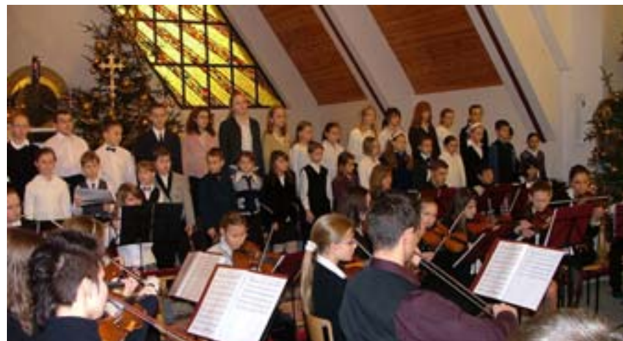
Koncert chóru i orkiestry PSM w kościele św. Jana w kowalach Oleckich.