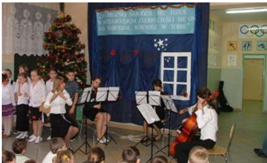
Montaż słowno-muzyczny w Zespole Szkół w Wieliczkach.

Nasze koleżanki zostają gorąco przyjęte przez dzieci i młodzież. To naturalne, ponieważ nie mają oni możliwości częstego kontaktu z muzyką na żywo. Taka publiczność, to czysta przyjemność!