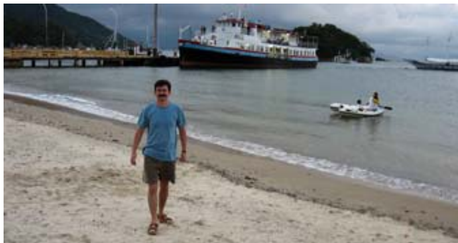
Na wyspie Ihia Grande.