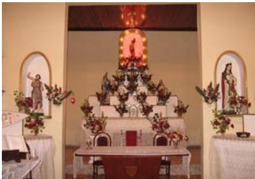
Ołtarz i sztuczne kwiaty.

Po drodze minąłem trzy platformy wiertnicze. O godz. 15. przypłynąłem na wyspę, do wioski z hotelami. Zakwaterowałem się w jednym z hoteli i wykąpałem pod prysznicem. Woda była bardzo miękka, taka delikatna, wprost aksamitna. Obsługa hotelu nie zna angielskiego, tylko portugalski, więc nijak nie mogłem się z nimi dogadać. Wszystko „załatwiałem” na wyczucie, oni chyba też. W przydrożnej restauracyjce zjadłem drogą obiadokolację (18 reali = 27 zł). Nie miałem wyjścia.