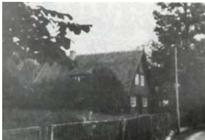
Dom Jahna latem 1989 roku