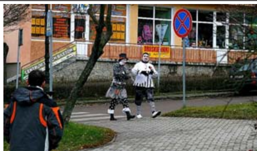
Przybyli już pierwsi egzotyczni turyści do Olecka, żeby „polatać” po mieście i jego okolicach.

PKK RSWI działa dzięki uprzejmości Starostwa Powiatowego w Olecku, ul. Kolejowa 32 pokój 12.