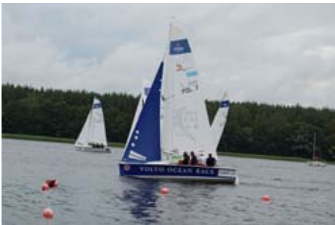
Łódka Volvo Ocean Race 2.