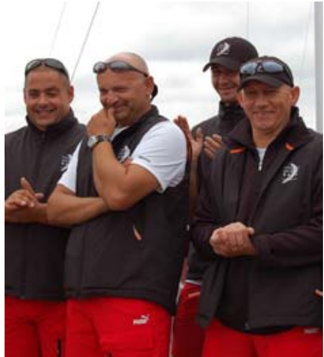
Załoga Volvo Ocean Race.

„Volvo zdecydowało się patronować Kampanii PGNiG Bezpieczne Mazury dostrzegając w projekcie te same wartości, które są ważne także i dla nas. Bezpieczeństwo i troska o środowisko to priorytety, o które nieustannie dbamy. Cieszymy się z wygranej, którą w zawodach odniosła łódka Volvo Ocean Race. Mimo zaciętej ry-