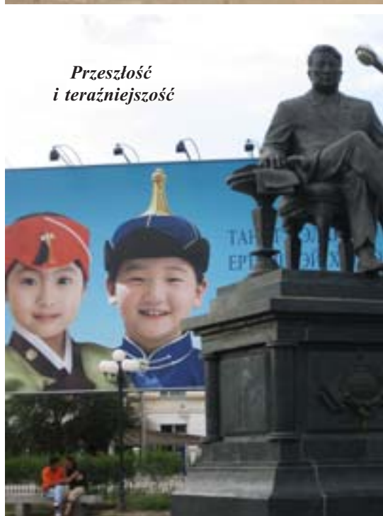
Przeszłość i teraźniejszość

konie i pastuchów; jak przed setkami lat – mało się tu zmieniło. Dzisiaj jeszcze doszła bieda.