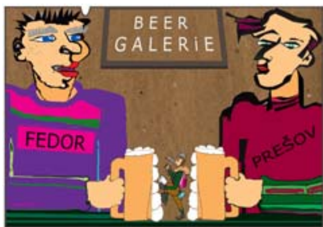
Rys. Wiesław B. Bołtryk