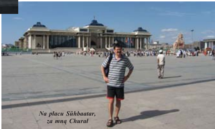
Na placu Sühbaatar, za mną Chural

Poszedłem spać o godz. 2 w nocy. Było duszno. Mongołka włączyła wiatraczek. Obudziłem się po godz. 7. Za oknem Pustynia Gobi. Piach i piach, bezludzie. Dopiero przed Ułan Bator pojawił się step, a później drzewa. Po drodze nie było żadnego miasta – w naszym rozumieniu tego słowa. Owszem były, ale „mongolskie”, czyli po prostu pustynne osady ludzkie z kilkunastoma lub kilkudziesięcioma budynkami z pustaków i drewna. Reszta to jurty. Za samochodami jadącymi przez step unosił się tuman kurzu. Na stepie od czasu do czasu widać było stada zwierząt, owce, kozy,