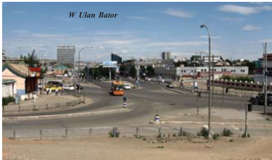
W Ułan Bator