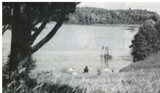
„Okrągłe jezioro” w okolicy Ilgenenthal