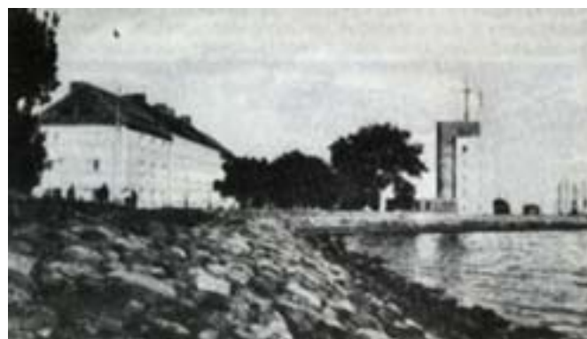
Strażnica pilotów w Pilawie

Latem 1937 roku nasza 4-dniowa wycieczka prowadziła do Królewca i Pilawy.