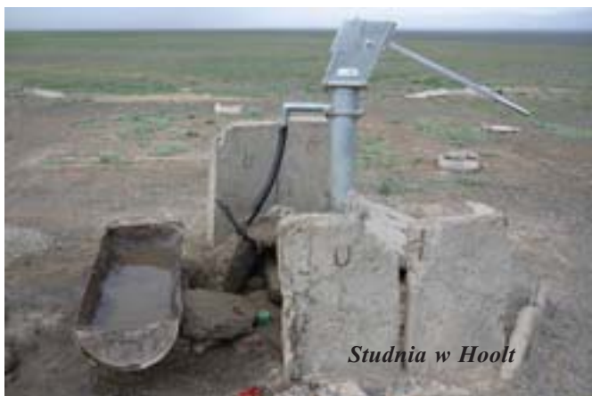
Studnia w Hoolt

opasuje trzema rzędami włosianego sznurka.