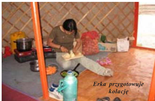
Erka przygotowuje kolację