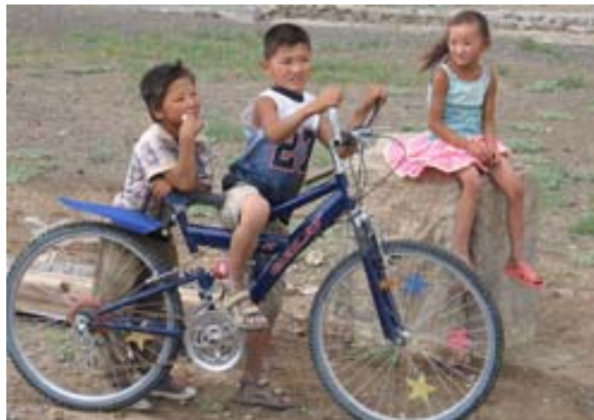
Rower to rzadkość

Rozmiary jurty zależały od ilości żyjących w niej osób. Zazwyczaj jurta ma od 4 do 12 ścian. Drewniany szkielet i inne elementy jurty są lekkie i wygodnie w montażu i w transporcie. Waga średniej wielkości jurty wynosi około 240 kg. Składanie i rozkładanie jurty odbywa się w określonym porządku. Najpierw układa się podłogę, na podłodze ściany, które składają się z drewnianych krutek, poszczególne sekcje łączy się jedna z drugą i razem z drzwiami, potem całość obwiązuje się sznurem. W środku na dwóch kolumnach ustawia się toono (okrągłe okno) i łączy się z drewnianą konstrukcją szkieletową. Całość pokrywa się białym cienkim płótnem, a następnie wołtokiem i