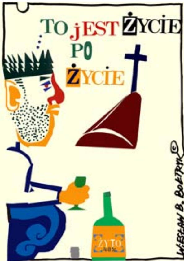
Rys. Wiesław B. Bołtryk