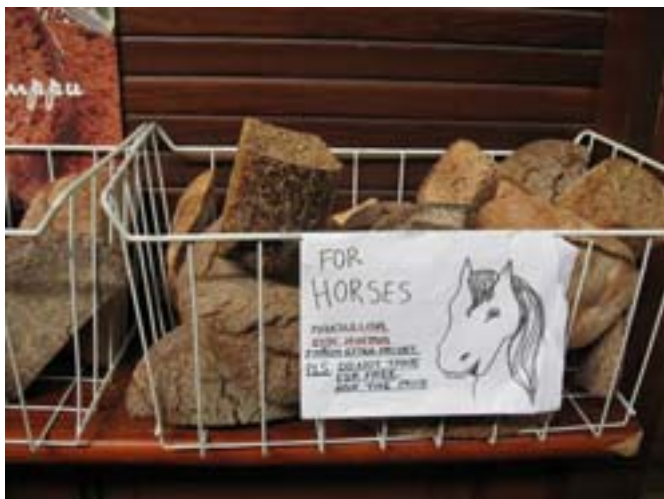
W Helsinkach zbierają suchy chleb dla konia

Pokoje w hostelu nawet niezłe, ale toaleta w korytarzu. Wejście do kuchni po godz. 23. nie jest już możliwe i nawet nie można wtedy ugotować wody na herbatę. Dobrze, że mieliśmy grzałkę – stary dobry wynalazek. Po skromnym „dżemowym” śniadaniu poszliśmy jeszcze do miasta. Chodziliśmy po nabrzeżu.