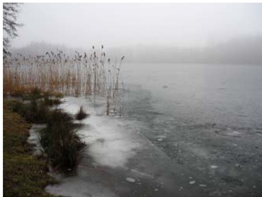
Tajemnicze Jezioro Stopka.