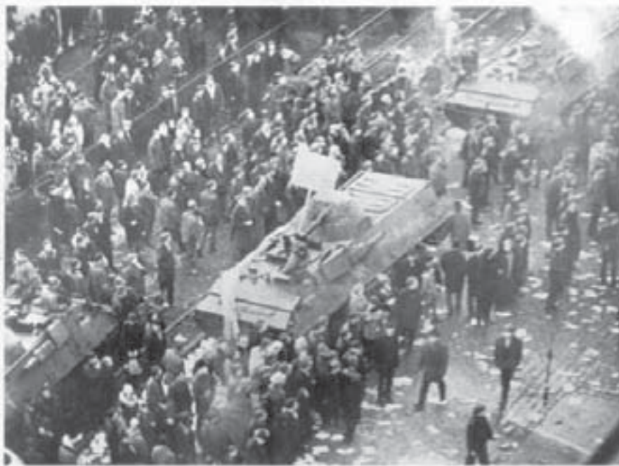
Grudzień 1970 - wystąpienia chuliganów i bandytów.

Generał, który wydał rozkaz strzelania do ludzi dziś urasta do rangi bohatera narodowego. Są tacy ludzie, którzy gotowi są komuś takiemu postawić pomnik. Za co? Za to, że w grudniu 1981 roku nie pozwolił Rosjanom wejść do naszego kraju! Dla mnie to jest bzdura i to tak szyta grubymi nićmi, że przeraża mnie naiwność ludzi przyjmująca te kłamstwo jako prawdę. Określamy siebie ludźmi bardzo mądrymi. To dlaczego Ci Mądrzy Ludzie nie sięgną po pierwszą książkę generała, napisaną zaledwie w rok po 1989 roku, w której kilkakrotnie podkreślił, że ze strony wojsk radzieckich nie było w 1981 roku żadnego zagrożenia, bo już wczesną jesienią w tajnej depeście marszałek Kulikow kategorycznie odmówił wciągania wojsk radzieckich czy Układu