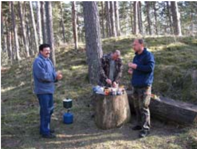
Posilek w Estonii

zajechał. On i jego koledzy, z którymi wybrał się w podróż, wystraszyli się zimna, olbrzymich pustych przestrzeni i śniegu. A też planowali zdobyć Przylądek Północny. Im się nie udało, nie chciało, nam tak!