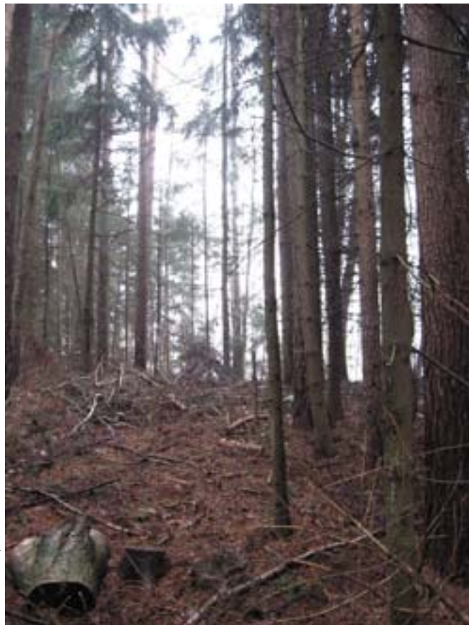
021- Grodzisko porośnięte tajemniczym lasem

wią, że jest ich nawet kilka. A szkoda, bo może udałoby się nam w ciszy i stanowczo ją przenieść – o tej porze roku nie ma jeszcze żab, węży czy potworów(?) i w nagrodę ujrzelibyśmy zamek, który jakoby tu istniał. Ponadto dostalibyśmy dużo pieniędzy, złota i bylibyśmy... bogaci! Tylko, że trzeba byłoby ją poślubić, co mógłbym uczynić tylko ja (Woj-