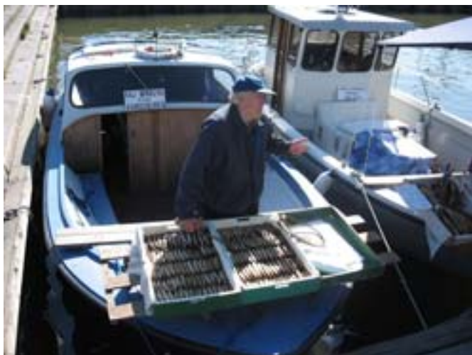
Fiński sprzedawca ryb

Pogoda była znośna, chociaż wiał silny wiatr. Na promie ciekawe towarzystwo. Praktycznie każdy nosił ze sobą reklamówki i kartony alkoholu, kupione na promie. Sporo ludzi