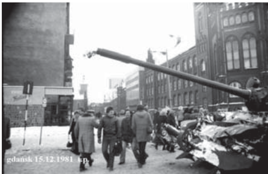
Grudzień 1981 - obrona przed Armią Czerwoną.

szym „Generale Herosie”. Jeszcze parę lat i kolejne książki o stanie wojennym wg naszego bohatera a dowiemy się, że całkowitą winę za Stan Wojenny i 13 grudnia 1981 ponoszą robotnicy i „Solidarność”, która brutalnie chciała napaść na Związek Radziecki i nasz generał jak Czapajew z grantem w jednej ręce i maksimum na plecach bronił pokoju na świecie. I na pewno, jak w przypadku tych, co pod koniec 1981 roku słyszeli w strefie przygranicznej radzieckie czołgi, znaleźliby się kolejni co słyszeli jak „Solidarność” i robotnicy szykowali się na inwazję Kraju Rad. Dla tych co słyszeli czołgi na granicach w listopadzie i grudniu radziłbym pójść zbadać słuch. Wg już dziś oficjalnych danych od jesieni 1981 roku w pobliżu granic z polską znajdowały się trzy dywizje pancerne. Najbliższa stacjonowała w Wilnie. I to nawet nie były pełne dywizje. Dwie na terenie dzisiejszej Ukrainy były w trakcie przemieszczenia w pobliżu granicy ZSRS - Afganistan i już od grudnia 1981 pierwsze pododdziały tych dywizji brały udział w działaniach wojennych w Afganista-