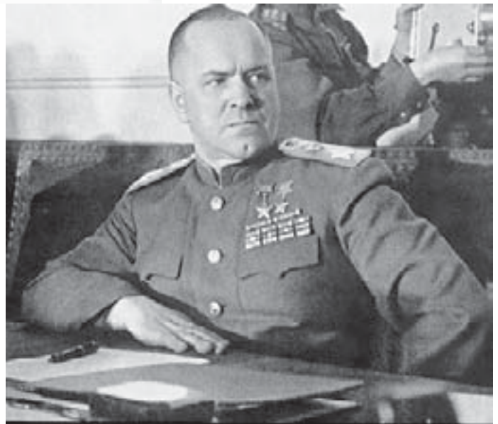
Żukow - bohater fantasta.

ła na granicach, a jej żołnierze spali w butach pytając: „co to za generał ten Wałęsa, że im każe w kamaszach spać?”. Trzecia książka i kolejne „Generała Bohatera” już oficjalnie opisują jak to generał własną pierśią bronił Polski przed Czerwoną Zarazą, jak Piłsudski w 1920 roku. I ludzie uwierzyli! Ba, ilu z Państwa zna takich, co sły-