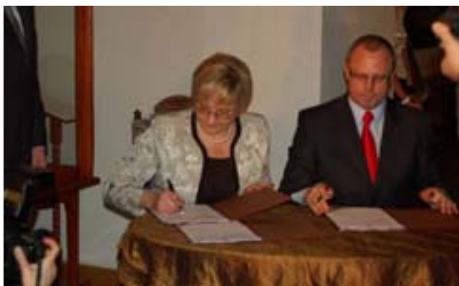
Uroczyste podpisanie umowy.

starania na rzecz ciągłego podnoszenia bezpieczeństwa i komfortu nauki jazdy prowadzonych przez olecką firmę. Uważam, że to wyróżnienie jest też niezwykle ważne ze względu na jego symboliczny charakter. Doceniono nie kosmiczne tech-