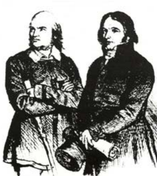
2. Friedrich Ludwig Jahn (z lewej) oraz Ernst Moritz Arndt

W 1813 roku Friedrich Ludwig Jahn i Karl Friedrich Friesen zapoczątkowali niemiecką gimnastykę, podtrzymując się mottem „Frisch, Frei, Fröhlich, Fromm” (Świeży, Wolny, Wesoły, Pobożny), którego cztery litery „F” ułożone w znak krzyża były symbolem rozpoznawczym tej formacji. Z powodów politycznych gimnastyka była jednak już w 1819 roku zabroniona w Prusach i dopiero w roku 1842 na mocy rozkazu królewskiego, zakaz ten zniesiono. W związku z tym mieszkańcy Królewca założyli już 27 czerwca 1842 roku „Królewiecki Męski Związek Gimnastyczny z 1842” (KMZG 1842), który był tym samym najstarszym związkiem gimnastycznym w Prusach.