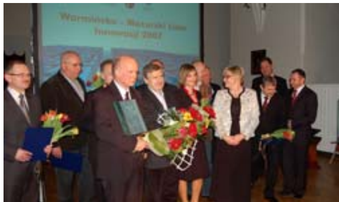
Laureaci konkursu „Warmińsko-Mazurski Lider Innowacji 2007”