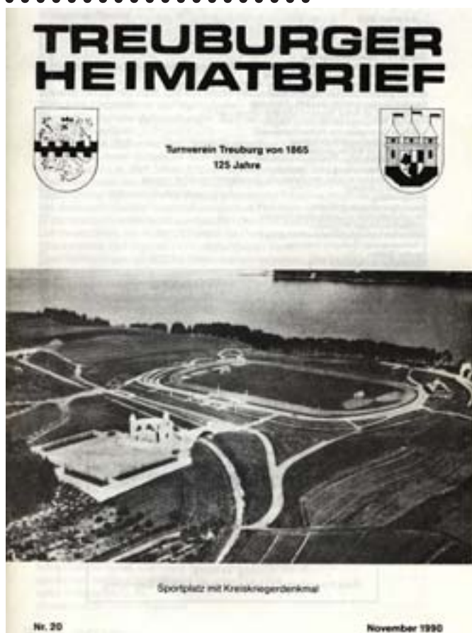
Związek gimnastyczny Olecko z 1865 (ZGO 1865) Autorstwa Gerharda Biallasa