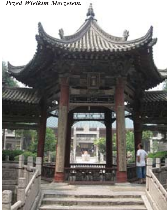
Przed Wielkim Meczeta.

dość skomplikowanym systemem obronnym, a to z racji tego, że w tamtych czasach nie posiadano broni zdolnej zniszczyć tak potężne mury, więc wróg mógł dostać się do miasta właśnie przez bramę. Stąd jej umocnienia. Pierwotnie mur zbudowany był z warstw ziemi. Ta bazowa zawierała także wapno i ekstrakt z kleistego ryżu. Na przestrzeni wieków mury miejskie Xi'anu trzykrotnie remontowano i restaurowano. Po raz pierwszy w 1568 roku, użyto już wtedy cegieł. W 1781 roku wyremontowano mury i wieże przy bramach. Po raz ostatni, już całkiem niedawno, odrestaurowano mur w roku