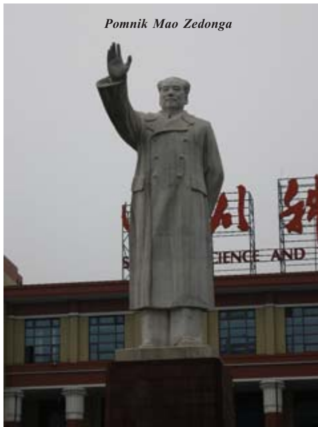
Pomnik Mao Zedonga