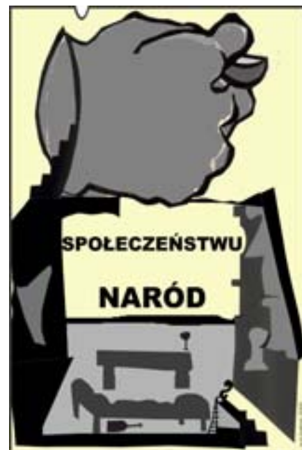
Z cyklu Rzecz Pospolita . Rys. Wiesław B. Boltryk