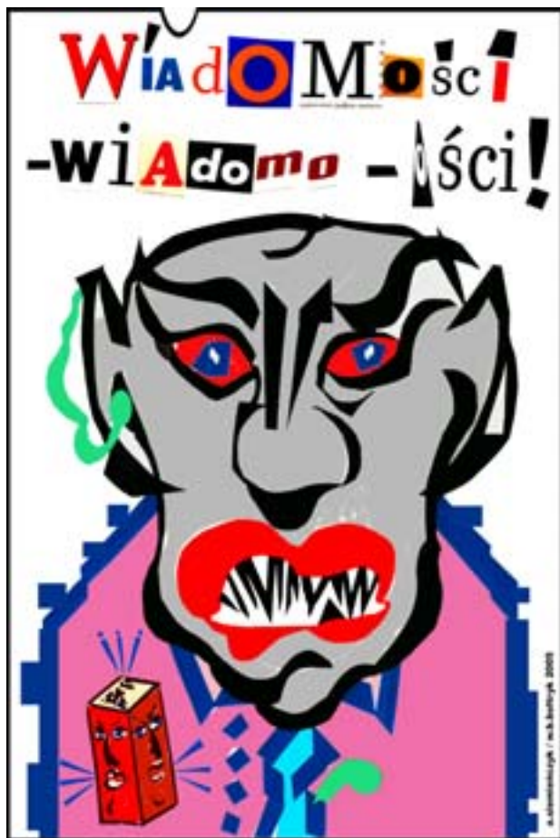
Wiadomości. Rys. Wiesław B. Boltryk

Zapraszamy do udziału w uroczystościach.