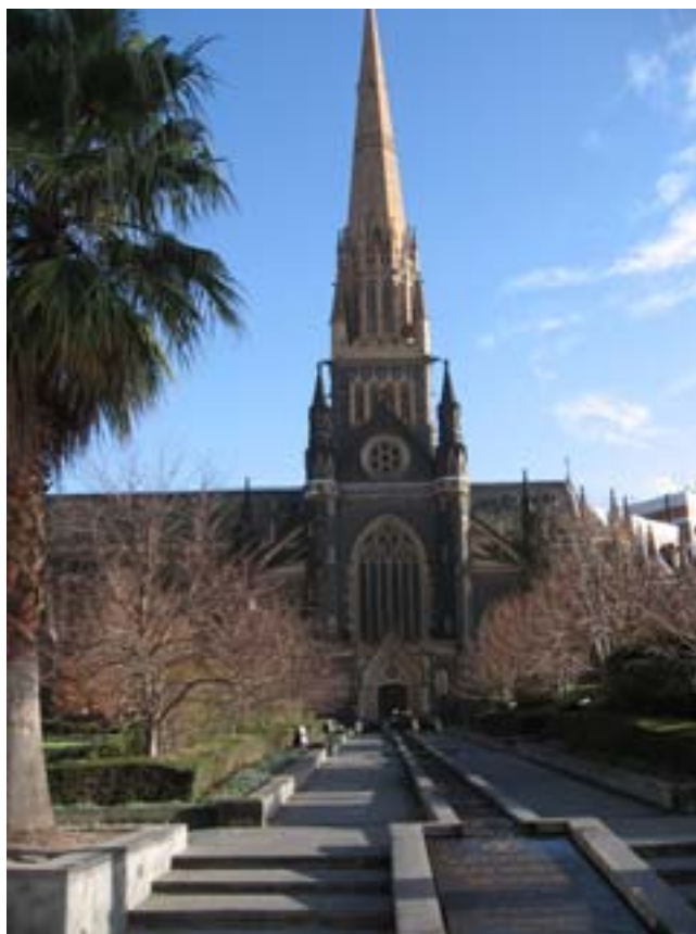
Katedra św. Patryka.

przypominały mi raczej jakąś sektę, niż grupę katolicką.