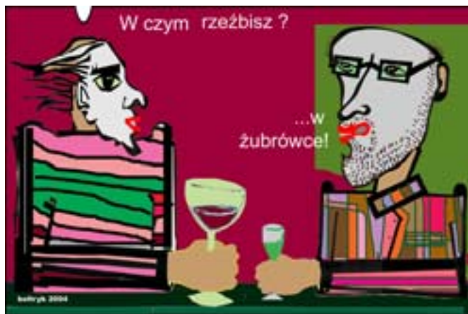
W czym rzeźbisz? ...W żubrówce!. Rys. Wiesław B. Bołtryk