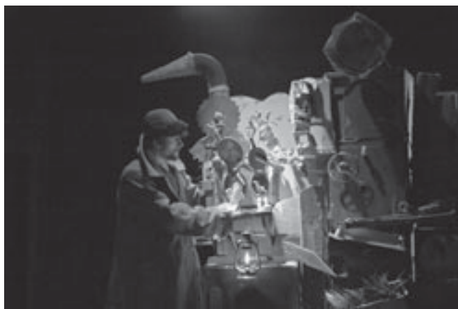
„Mała pasja, czyli historia o psie Pana Jezusa”, Teatr „Wierszalin”.

4 grudnia, w piątek, mieliśmy okazję uczestniczyć w dwóch spektaklach teatralnych: „Mała pasja, czyli historia o psie Pana Jezusa” Teatru Wierszalin i „Wydech”, Teatru Krzyk.