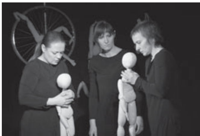
„...etcetera”..., Teatr K3.

nają zastępować symbole, media, obcy ludzie. To dość bolesne, ale jednocześnie prawdziwe, bo ojcowie z dawnych patriarchów rodziny, głów rodów zaczynają spełniać raczej rolę partnerów, którzy odgrywają role dodatkowe, uzupełniające itd. Stąd też brak odniesienia do charyzmatu ojca jest wypełniany, ale nie zastępowany, przez bardzo sztuczne twory naszej cywilizacji i rozwijającej się kultury konsumpcyjnej, które tylko pogłębiają pustkę, samotność i odosobnienie w tłumie. „Wydech” to bardzo dobry spektakl, który długo pozostaje w głowie i wymusza na człowieku refleksję i potrzebę obejrzenia się wokół: bo może to właśnie o mnie?