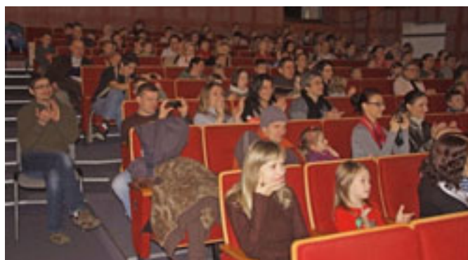
Widzowie podczas spektakli dla dzieci.