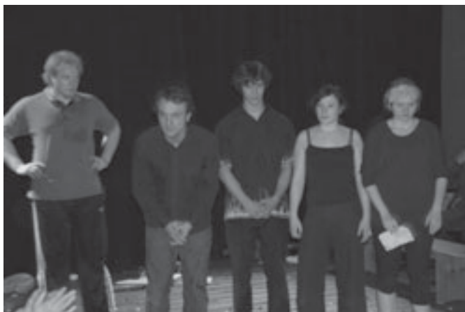
„Wydech”, Teatr „Krzyk”.

Wrażenie na mnie zrobił Teatr Krzyka. Ich „Wydech” naprawdę oglądało się na niezłym wydechu. Rzadko ogląda się tak brawurowe spektakle niezawodowe, gdzie aktorzy grają z taką pasją. Treścią sztuki był ojciec, a konkretnie bardzo symboliczne i sugestywne odniesienia do roli ojca w dzisiejszym świecie. Widać było w tym przedstawieniu wiele prawd, jakie towarzyszą naszemu światu aktualnie. Świat staje się globalną wioską, gdzie kontakt z najbliższymi zastępują media: sieć komputerowa – internet, telefony komórkowe. Rola rodziców, a konkretnie ojców, zamienia się w coś w rodzaju cienia – ciągle nam towarzyszy, jest obecny, a jednak bardzo odległy, prawie obcy i niezauważalny. Rola ojca staje się niemal symboliczna, obdarta z człowieczeństwa. Ojca zaczy-