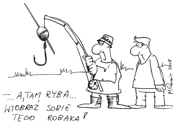
Rys. Marek Pacuński