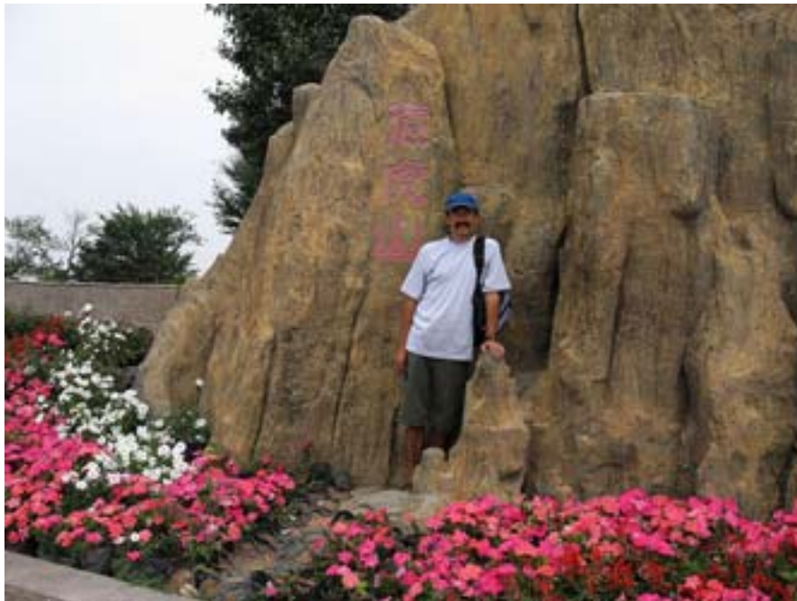
Wszyscy się tu fotografowali. Ja też.

Najważniejszym tematem jest tu zawsze rodzina. Wszystko właściwie jej dotyczy. Czasem są to próby jej zbudowania, czasem bunt i odwrócenie od tradycyjnego modelu życia. Rodzina jest tym, co kształtuje osobowość przedstawionych postaci, określa ich charakter i zwyczaje. Prawie całe ich życie koncentruje się wokół najbliższych, nawet, jeśli są z nimi skłócenia i nie zgadzają się w istotnych kwestiach. To oni są zawsze