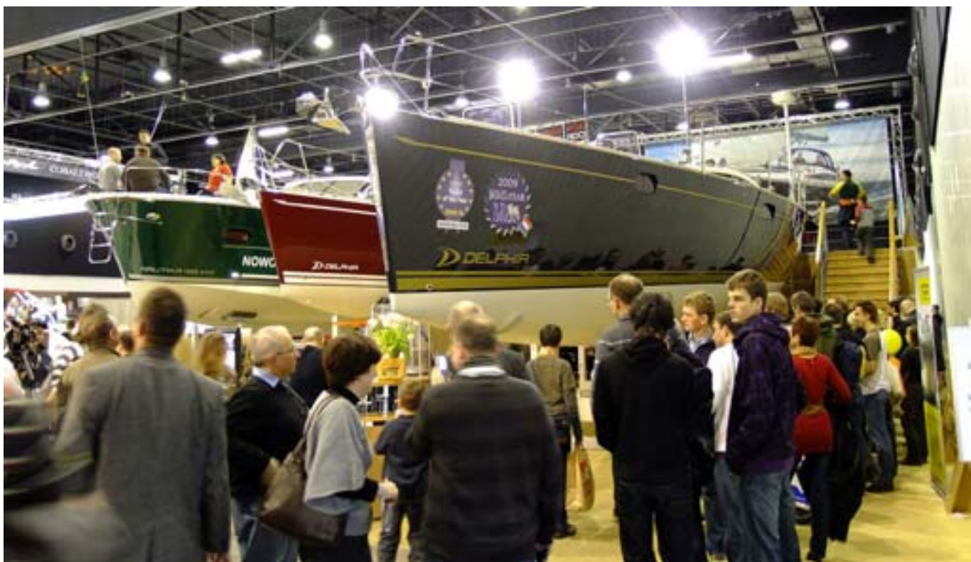
Stoisko stoczni jachtowej Delphia Yachts.

Nagroda przyznawana jest w pięciu kategoriach.