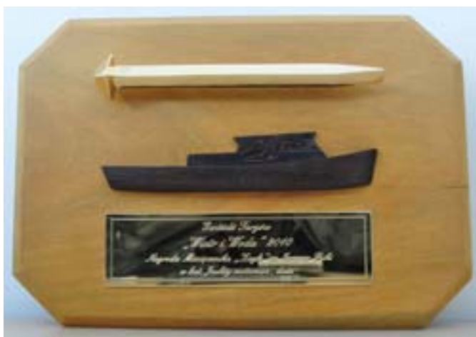
Nagroda Gwóźdź targów Wiatr i woda, Nagroda miesięcznika „Żagle”, kategoria: Jachty Motorowe, duże

Nautika 1000 eko to nowoczesny jacht spacerowy, przyjazny środowisku. Doskonały do pływania zarówno na jeziorach, kanałach, jak i rzekach. Ten ekologiczny jacht motorowy wyposażony jest w silnik elektryczny, dzięki któremu można nią pływać również w strefach ciszy.