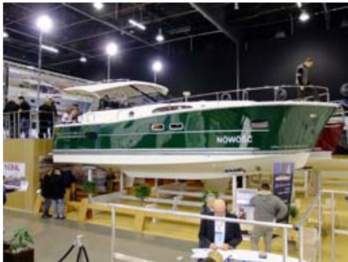
Nautika 1000 eko, zwiedzanie jachtu podczas targów Wiatr i Woda.

Zasilana ośmioma akumulatorami pozwala na pływanie nią bez konieczności ich doładowywania cały dzień. Nautika 1000 eko to doskonały kompromis łączący funkcjonalność, przestronność i estetykę. Jacht jest cichy i nieskomplikowany w obsłudze. Zgodnie z ideą jachtu spacerowego może być prowadzony bez uprawnień.