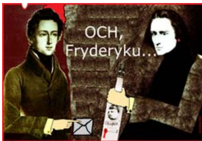
Fryderyk i Franciszek. Rys. W.B. Boltryk.