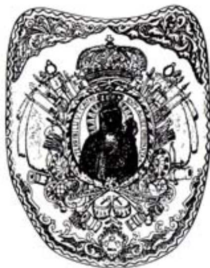
Ryngraf rycerski z herbem „Mogiła” rodu Stankiewiczów. Ze zbiorów Polskiego Muzeum Historycznego w Muri.