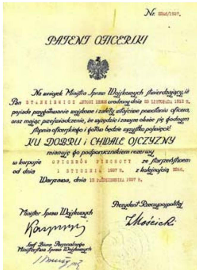
Patent oficerski podporucznika rezerwy ze starszeństwem, nadany w 1937 r.