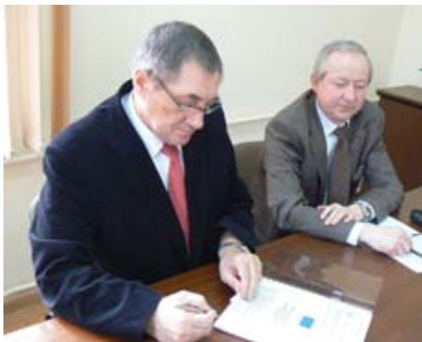
Przedstawiciele Zarządu PRIBO-EPB.

Beneficjent: Przedsiębiorstwo Gospodarki Odpadami „Eko-MAZURY” Sp. z o.o., ul. Marsz. J. Piłsudskiego 2, 19-300 Elk, www.eko-mazury.elk.pl_eko-mazury@elk.com.pl