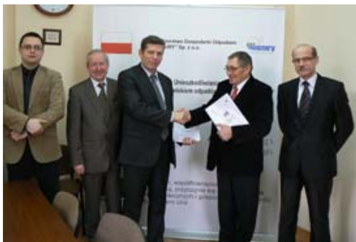
Przedstawiciele Firm Eko-MAZURY oraz PRIBO-EPB.