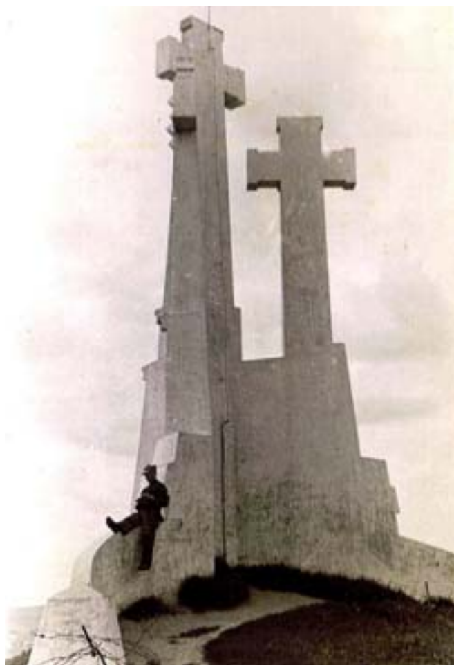
Tolek „zwycięski” u podnóża pomnika Trzech Krzyży, na Górze Trzykrzyńskiej dominującej nad Wilnem.

5 marca 1940 r. Biuro Polityczne KC zarządzane przez Stalina wydało wyrok śmierci na polskich jeńców wojennych zatrzymanych w sowieckiej Rosji. Wniosek o zastosowanie