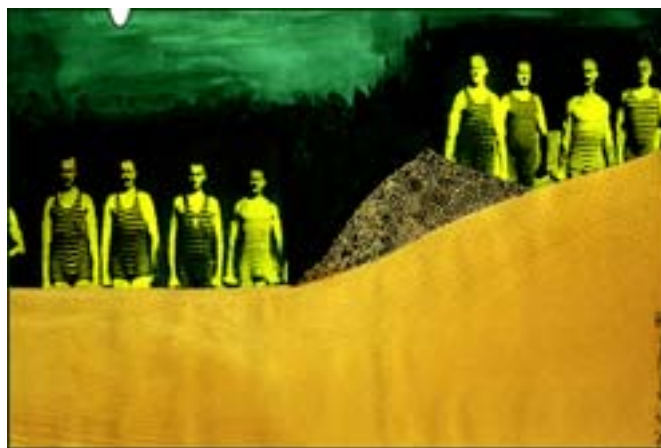
Chłopcy z Placu Broni.