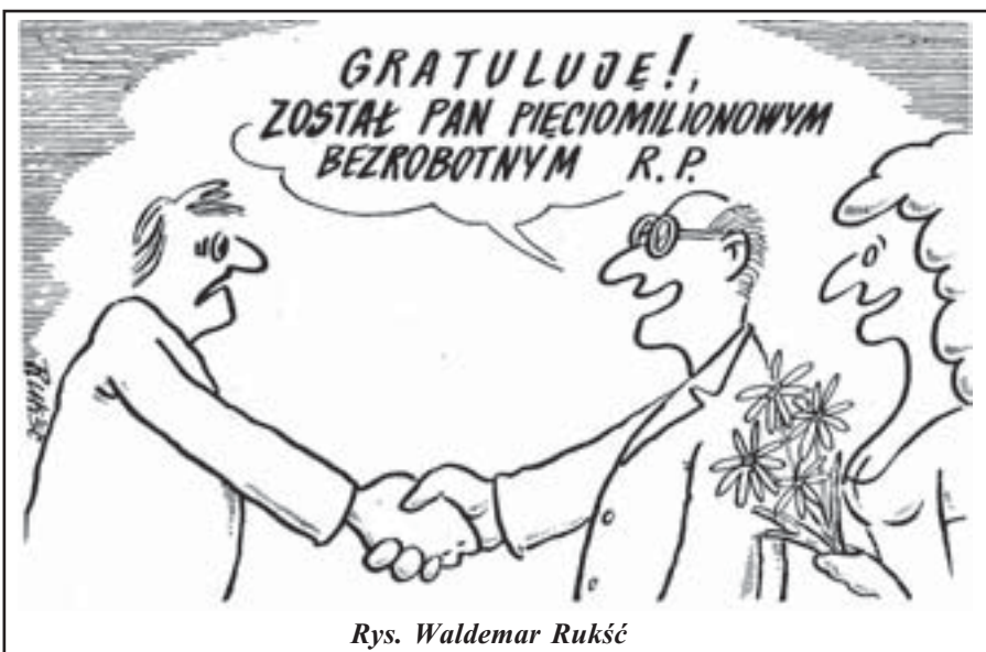
Rys. Waldemar Rukść