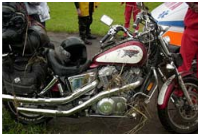
„Wiśniówka” po ślizgu.

Podchodzę do motocykla, wyłączam awaryjnie zapłon, zamykam kranik paliwa i wyciągam ze stacyjki kluczyk. Strasznie to wygląda. Taki Chopper nie jest stworzony do tyłania się w błocie. Leży jak ranny koń, na prawym boku, w przeciwnym kierunku do naszej jazdy. Z auta wysiada jeszcze jedna para. Podchodzą. Próbuje podnieść motocykl, ale nie dają rady – dziwnie zaczyna boleć prawa ręka.