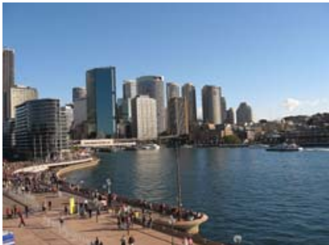
Widok na Sydney sprzed gmachu opery.

Australia kojarzona jest na świecie właściwie z tym budynkiem. A ja miałem i mam niesamowite szczęście, że oglądałem własnymi oczyma to чудо współczesnej architektury. Autorem tej eleganckiej konstrukcji jest duński architekt Utzon. Prace budowlane rozpoczęto w 1959 roku i trwały one 14 lat, aż do roku 1973. Uroczyste otwarcie odbyło się 20 października 1973 r. Specjalnie na tę okazję do Sydney przyleciała królowa brytyjska - Elżbieta II. Zagrano wówczas IX Symfonię Bethovena, a także wystawiono „Wojnę i Pokój” Prokofiewa.