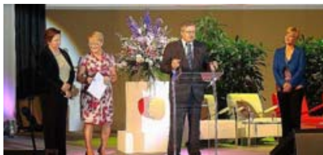
Wystąpienie B. Komorowskiego.