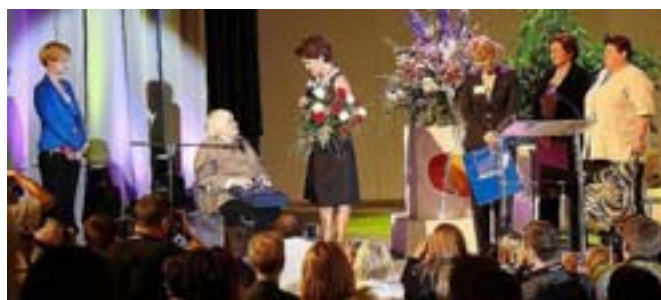
Wręczenie Nagrody Specjalnej Kongresu Kobiet profesor Marii Janion.