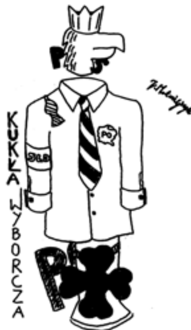
Rys. Jakub Matwiejczyk