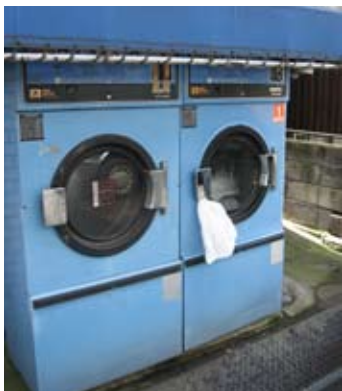
Jokohama. Pralki na chodnikach

Jeśli Japonka zdecydowała się na pracę musiałaby oddać dziecko do żłobka, co nie jest dobrze widziane