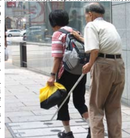
W Japonii ludzie biją rekordy długowieczności

W epoce Edo stosowano wobec kobiet zasadę danson jahi - szanować mężczyznę, pogardzać kobietą. Okres Tokugawa (Edo) to rozkwit gejsz (ta profesja trwa do dnia dzisiejszego i nie ma żadnego odpowiednika w innych kulturach), czyli jak głosi etymologia słowa geisha – ludzi (kobiet) sztuki, dziś powszechnie uważane po prostu za damy do towarzystwa. Okres Meiji to czas otwarcia Japonii na świat. Przybywali wówczas do Kraju Kwitnącej Wiśni Amerykanie i Europejczycy i zachwycali się Japonkami, jako uprzejmymi, miłymi, ślicznymi kobietami!