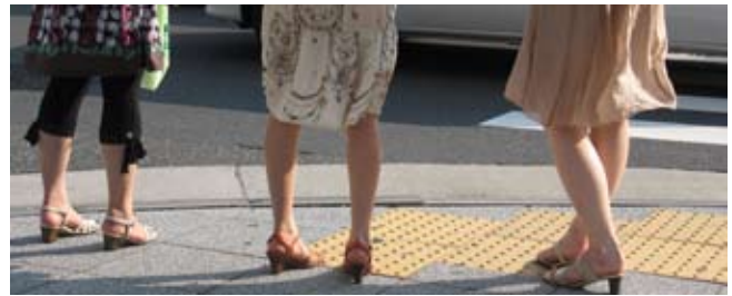
Japonki noszą też takie buty

uśmiechać się i usługiwać mężczyznom i gościom. Jestli natomiast któraś z kobiet zdecydowała się na wybór drogi kariery i awansów, zmuszo-