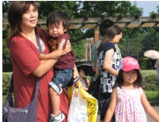
Japońska rodzina (ojciec jest w pracy)

Po II wojnie światowej otwarto Japonkom drogi edukacyjne, a także dano im swobodę kariery. Tak naprawdę tylko pozornie. Bo, jeśli kobieta wybierze tę drogę, nie będzie miała czasu na prowadzenie domu, wychowywanie dzieci, czyli nie będzie dobrą żoną i mądrą matką! Zazwyczaj pracują młode Japonki, które nie są jeszcze mężatkami, ale tak naprawdę nawet w najlepszych firmach pełnią one raczej role estetyczne, są sekretarkami, podają kawę, mają