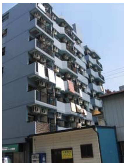
Typowy japoński blok mieszkalny

Kobieta musi być podporządkowana mężczyźnie, nie dopominać