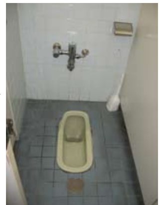
Typowa japońska toaleta

Oglądałem też japońską telewizję. Mnóstwo reklam i wyłącznie japońskie napisy. Mam niesamowitą frajdę przy korzystaniu z japońskiej toalety. Należy w niej kucać tyłem do drzwi – w polskiej toalecie – przodem.