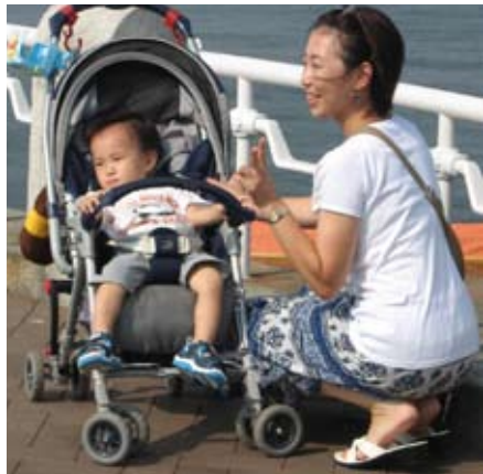
Japonka z dzieckiem

do przedszkola małe kuferki tzw. obento, w których zazwyczaj znajduje się ryż, ryba lub warzywa, ciasteczka ryżowe i jakiś napój. To bardzo ważne, by śniadanie było estetycznie zapakowane i odpowiednio skomponowane – ma to wymiar artystyczny np. ryż ułożony jest w „bałwanki”. Matka, która przygotowuje dziecku posiłek złożony z jakichś fastfoodów lub złej kombinacji pokarmów jest źle widziana w szkole, w społeczeństwie.