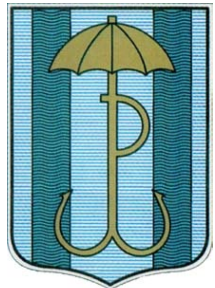
Plakietka honorowa żołnierzy batalionu „Parasol” Armii Krajowej (zaprojektowana już po II wojnie światowej)