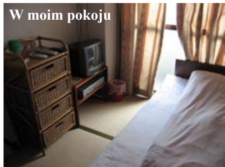
W moim pokoju

Dzień przeznaczaliśmy na piesze zwiedzanie Osaki.