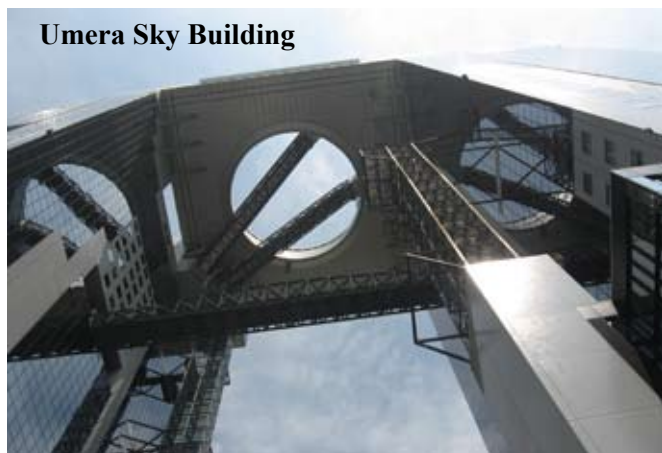
Umera Sky Building

platforma widokowa, z której rozlega się przepiękny widok na miasto i port. Drapacz chmur składa się z trzech szklanych wież połączonych na wysokości 173 metrów (39 pięter) właśnie tą platformą – obserwatorium pływającego ogrodu. Są tam prezentacje high-tech i centrum gier wirtualnych.