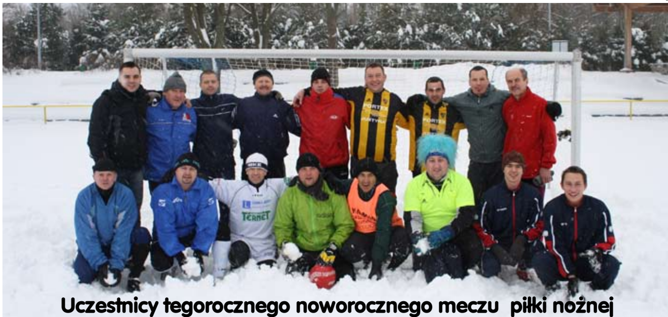
Uczestnicy tegorocznego noworocznego meczu piłki nożnej