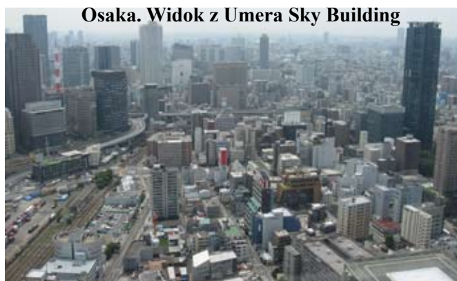
Osaka. Widok z Umera Sky Building

Później z przesiadkami dostaliśmy się do świątyni Shitennoji – czterech królów nieba. Jest ona uważana za kolebkę japońskiego buddyzmu. Świątynia była wielokrotnie niszczona przez pożary, a obecne zabudowania pochodzą z 1965 roku i nie mają szczególnej wartości. Jednak ludzie się tam