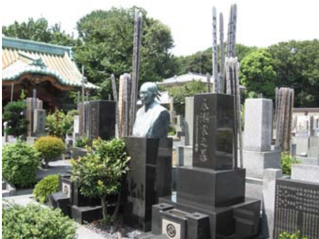
Na cmentarzu Yanaka

Poszedłem dzisiaj na słynny cmentarz Yanaka. Pomniki zwane sobota przypominają spiętrzone figury geometryczne: piramidy, półksiężycy, kule, sześciąty; oznaczają ziemię, wodę, ogień, powietrze i eter. Otaczająca je przestrzeń symbolizuje szósty element - świadomość. Cmentarz to nie tylko miejsce przypominające o końcu życia. Stanowi symbol przemiany, transformacji i obecności duchów. Na japońskich cmentarzach zapala się kadzidełka, a nie znicze. Praktycznie nie ma tu kwiatów.