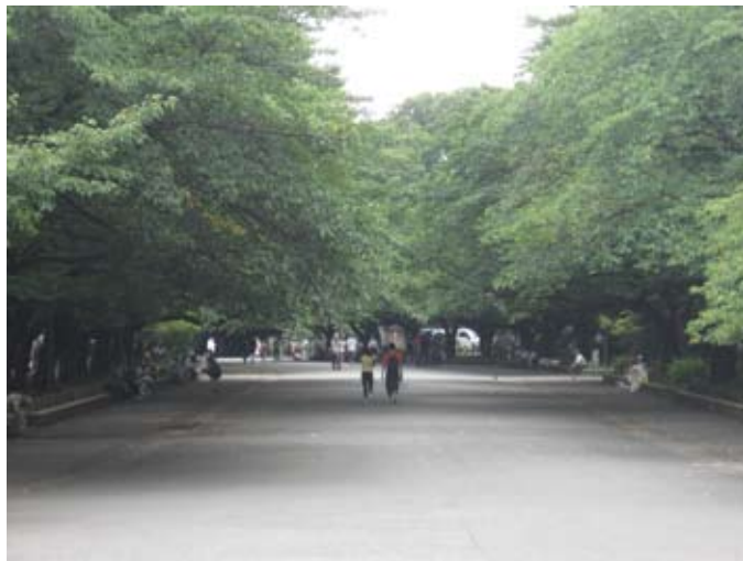
Drzewa wiśni w Parku Ueno

Kwitnąca wiśnia, sakura, jest w Japonii nieoficjalnym symbolem narodowym silnie umocowanym w tradycji i w kulturze. W ogrodach uprawia się dziesiątki różnych odmian ozdobnych tylko ze względu na kwiaty, a drzewka kwitną zaledwie kilkanaście dni. Jednak specyficzne położenie Wysp Japońskich rozciągających się z północy na południe sprawia, że kwitnienie wiśniowych drzew trwa w sumie pięć miesięcy. Na najbardziej wysuniętej na południe wyspie - Okinawie - pierwsze kwiaty wiśni pokazują się w styczniu, następnie na początku kwietnia w rejonie Osaki, Tokio, Kioto i wreszcie w maju na wyspie Hokkaido. Prognozy kolejnego kwitnienia wiśni w różnych regionach podawane są w Japonii regularnie w wiadomościach telewizyjnych i prasowych. W tych dniach mieszkańcy wysp świętują Hanami, czyli dni kwitnących wiśni, urządzając pod drzewami przyjęcia i pikniki. Niejedno wydarzenie wagi państwowej schodzi wówczas na drugi plan. W okresie kwitnienia wiśni w Złotym Tygodniu (29 kwietnia - 5 maja) wielu Japończyków bierze urlop.