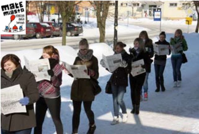
happening z gazetami