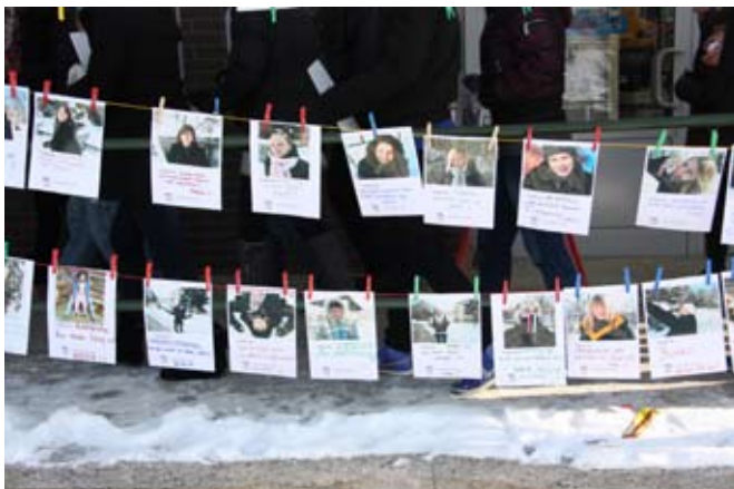
akcja „Czuję się...”