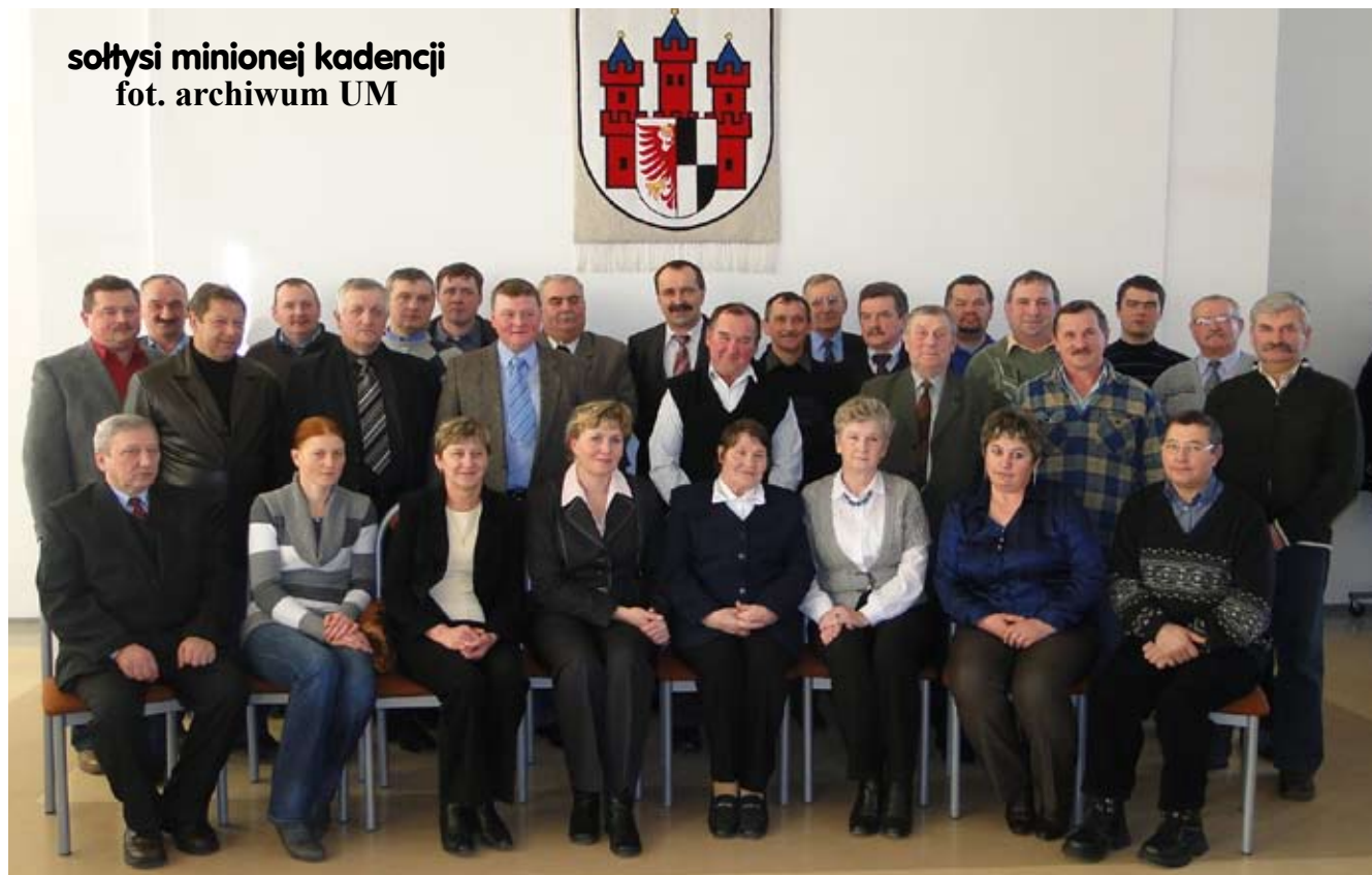
sołtysi minionej kadencji