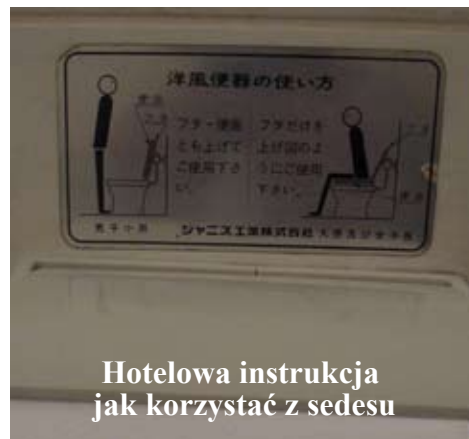
Hotelowa instrukcja jak korzystać z sedesu