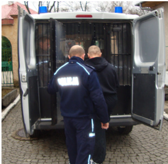
W drodze na przesłuchanie

Przełom w sprawie nastąpił we wtorek 17 kwietnia. Wtedy to jedna z mieszkanki powiadomiła policję o mężczyźnie wchodzącym na teren posesji. Usiłował on wejść do domu