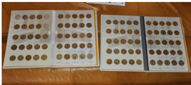
Kolekcja odzyskanych przez policję złotych monet