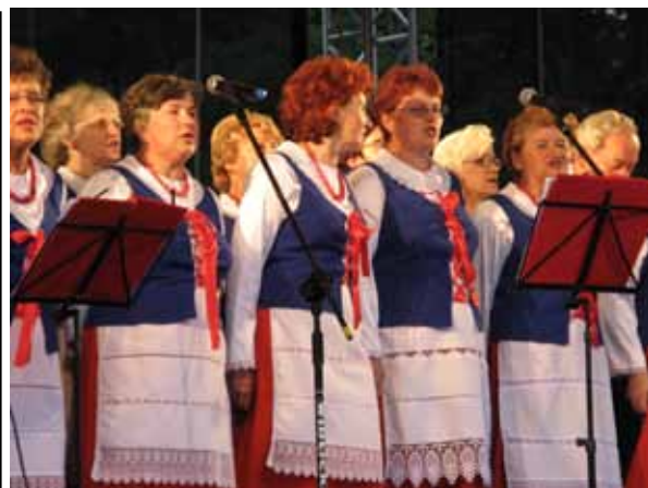
Mazurskie Spotkania z Folklorem fotoreportaż Marka Chlebanowskiego s. 10-11