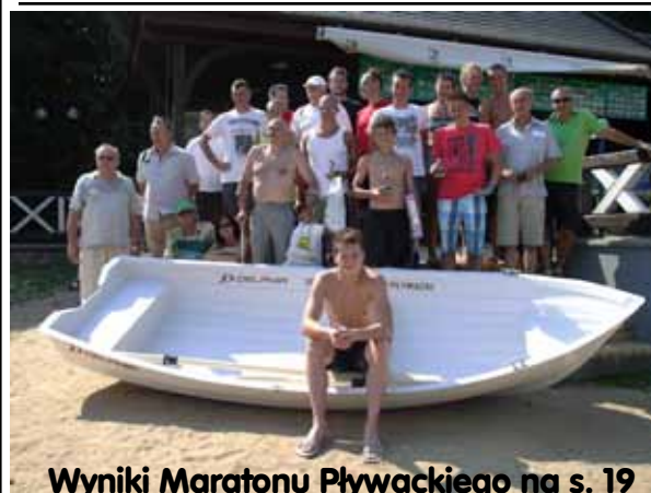
Wyniki Maratonu Pływackiego na s. 19

SKUP STARYCH I ROZBITYCH POJAZDÓW kasacja pojazdów, skup złomu, pomoc drogowa, autolaweta, zaświadczenia Najwyższe ceny, Olecko, ul. Eleka 2, tel. 501-611-961