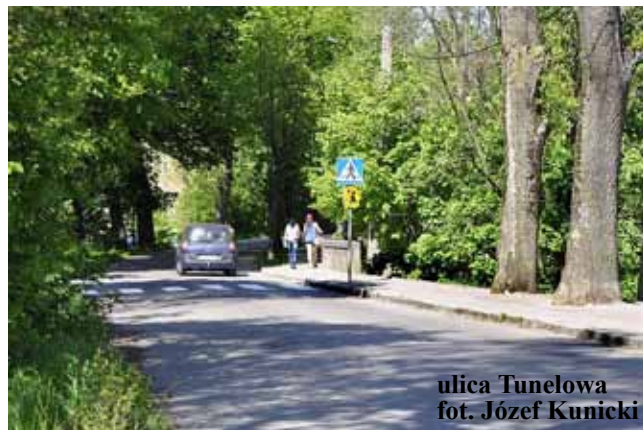
ulica Tunelowa

Sponsorzy: Stocznia Jachtowa Delphia Olecko, Oleckie Towarzystwo Sportu Szkolnego, Drogerie „STARS” Olecko, TESCO Olecko, Restauracja „ASTRA” Olecko, hotel „OLECKO”, hotel „SKARPA”, bar „KOALA”