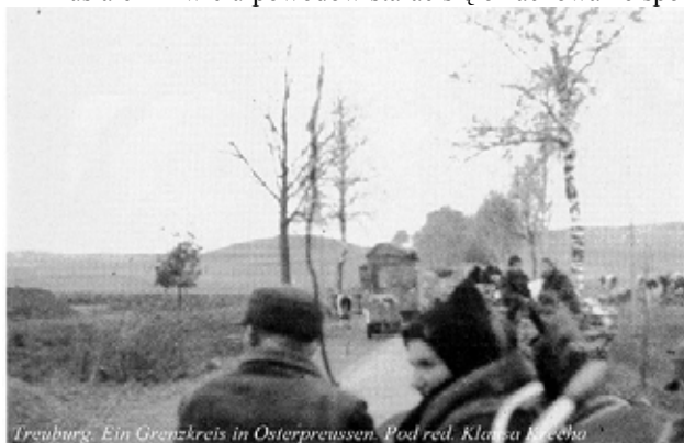
Treuburg. Ein Grenzkreis in Osterpreussen. Pod red. Klaus Kische

Musiałem z wielu powodów starać się o zachowanie spo-