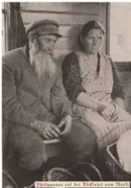
Uchodźcy na torach w Poczdamie

„Rzadko można było spotkać się ze współczuciem w stosunku do uciekinierów... Miejscowa ludność reprezentowała zazwyczaj stanowisko, iż wojnę przegrali uciekinierzy oraz przemaszerowujący przez miasto lub internowani żołnierze”.