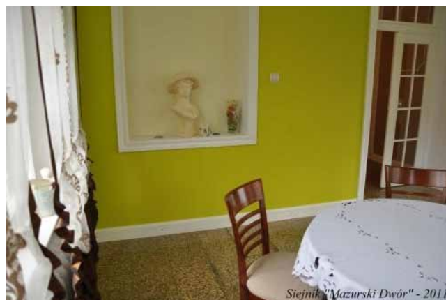
Siejnik „Mazurski Dwór”. 2011. fot. Józef Kunicki