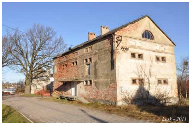
Lesk. 2011.

Niektórzy uciekali z obozu, lecz Rosjanie na ogół szybko ich łapali i surowo karali. Często pojawiali się ludzie z GPU. Odchodziły transporty na Syberię. Od czasu do czasu przesłuchiwało nas ponownie, wpytując o osoby związane z polityką. W obozie, oprócz Niemców, siedzieli również Węgrzy. Przed rozwiązaniem obozu przybyła do nas inspekcja UN. W skład komisji wchodził Kanadyjczyk, Amerykanin, Szwedzi i Szwajcarzy. Po ich wizycie nic nie uległo zmianie. Chorych i stare kobiety odesłano „do domu”. Reszta, około 95 procent więźniów, została wywieziona pociągami w głąb Rosji.