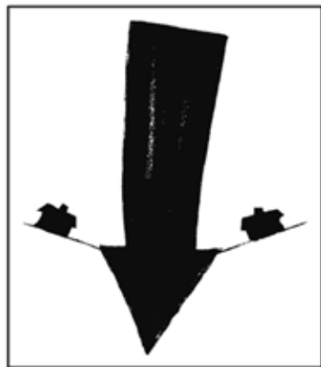
STOWARZYSZENIE KULTURALNE z siedzibą w Olecku