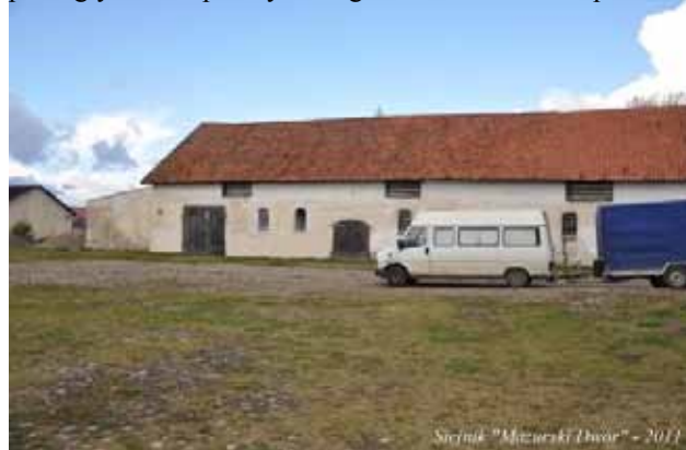
Siejnik „Mazurski Dwór”. 2011.

Musiłem jechać galopem i oddaliłem się od matki. Nie pomogły żadne prośby i błagania. Ona musiała pozostać