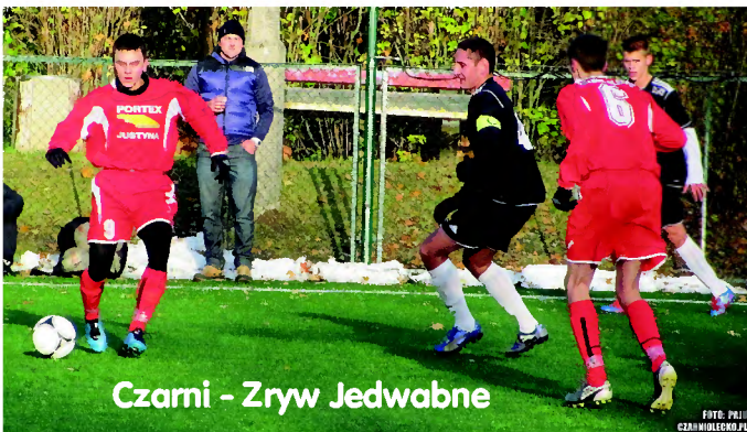
Czarni - Zryw Jedwabne