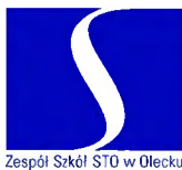
Zespół Szkół STO w Olecku