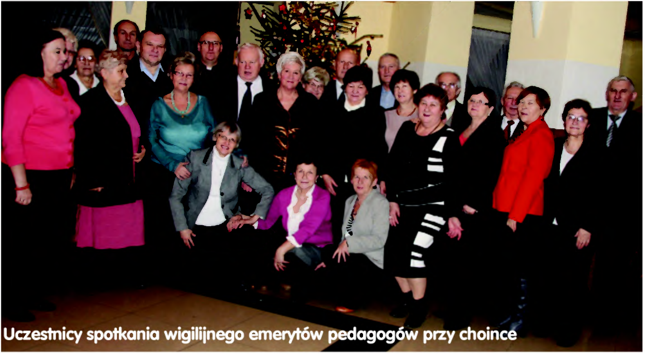
Uczestnicy spotkania wigilijnego emerytów pedagogów przy choince