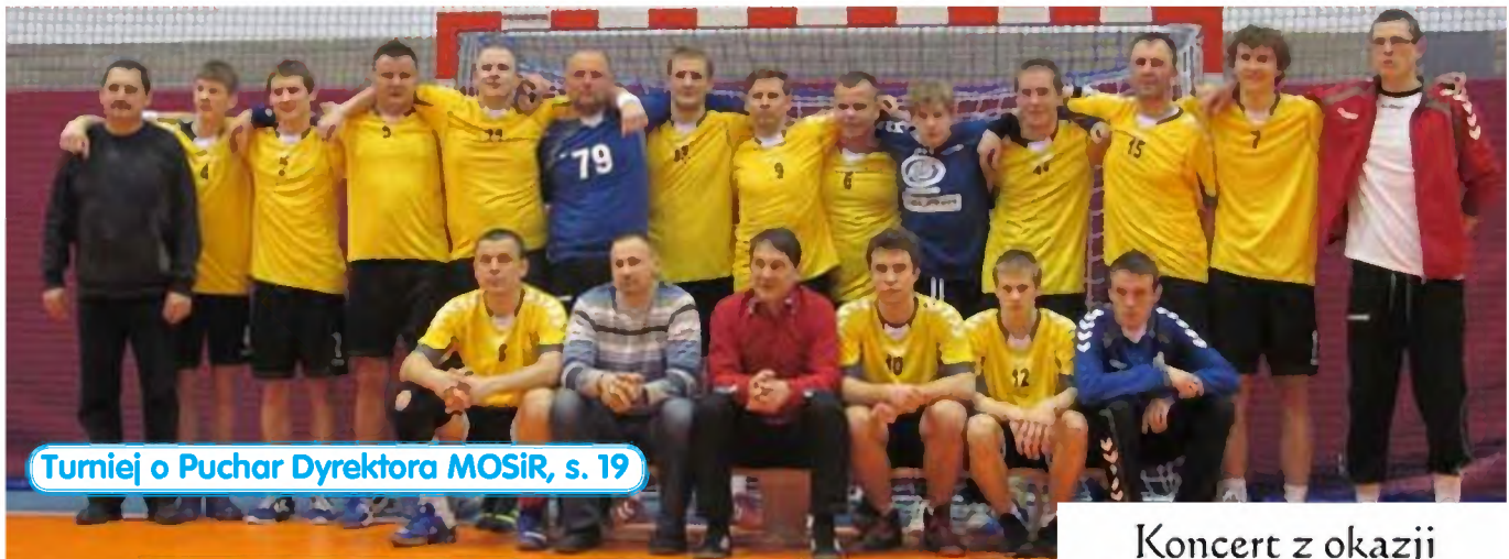
Turniej o Puchar Dyrektora MOSiR, s. 19