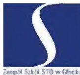
Zespół Szkół STO w Olecku