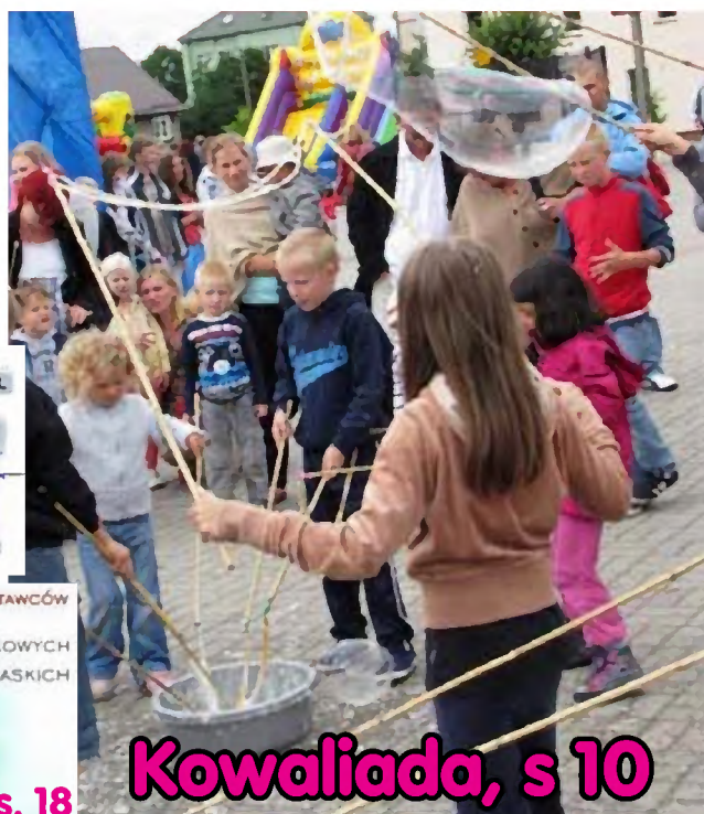
Kowaliada, s 10