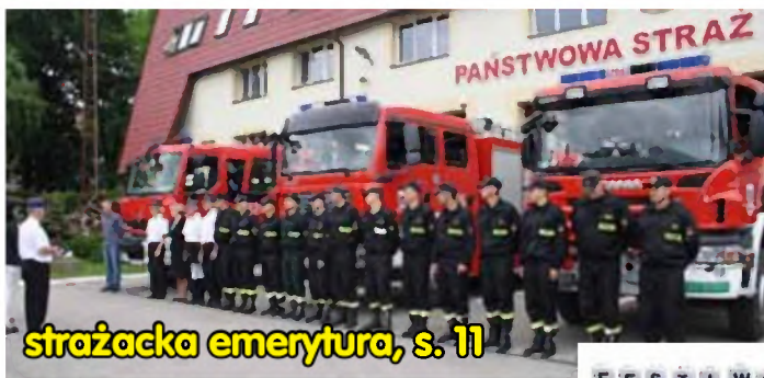
strażacka emerytura, s. 11