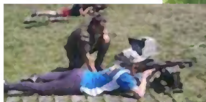
ZST: Wojskowe manewry s. 9