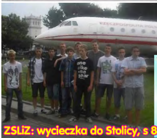
ZSLiZ: wycieczka do Stolicy, s 8